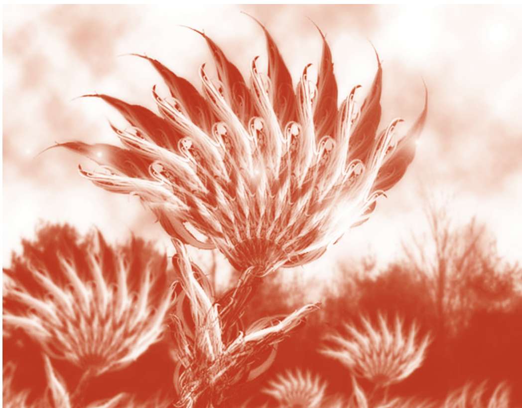
Flor Ilustración digital Luis López Botello 9º Diseñador Gráfico