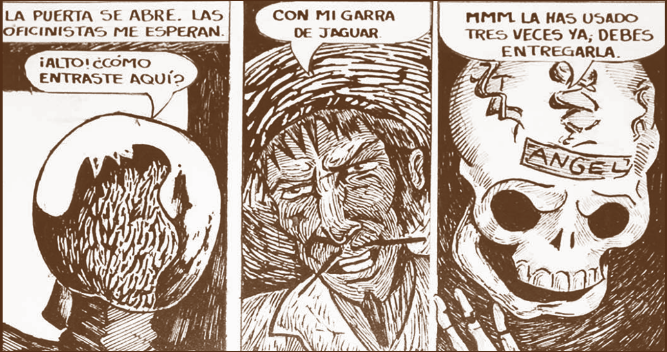
Fragmentos del cómic "Cristóbal el brujo" de Ensamble Comics Dibujos de Luis Alberto Villegas y Federico Aguilar Tamayo.