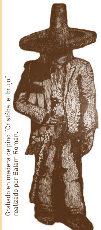
Grabado en madera de pino "Cristóbal el brujo" realizado por Balam Román.

Pasaron algunos años después de la inauguración del Museo de la Caricatura para que se presentara la colección permanente "La caricatura en la historia, historia de la caricatura". Este proyecto tomó casi tres años de intenso trabajo e investigaciones. Se logró reunir 320 caricaturas originales con lo más sobresaliente de los años 1823 a 1995.