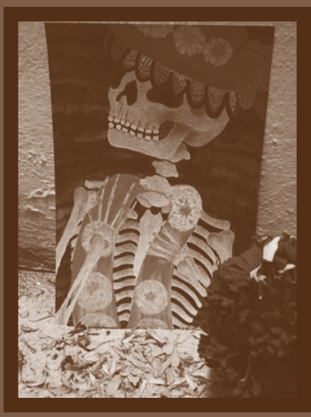
Ilustración de alumnos de talleres impartidos en el Museo de la Caricatura.