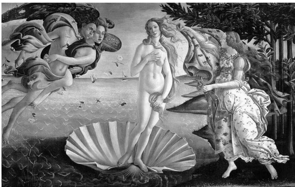
El nacimiento de Venus (La nascita di Venere), Sandro Botticelli, temple sobre lienzo, 1484.