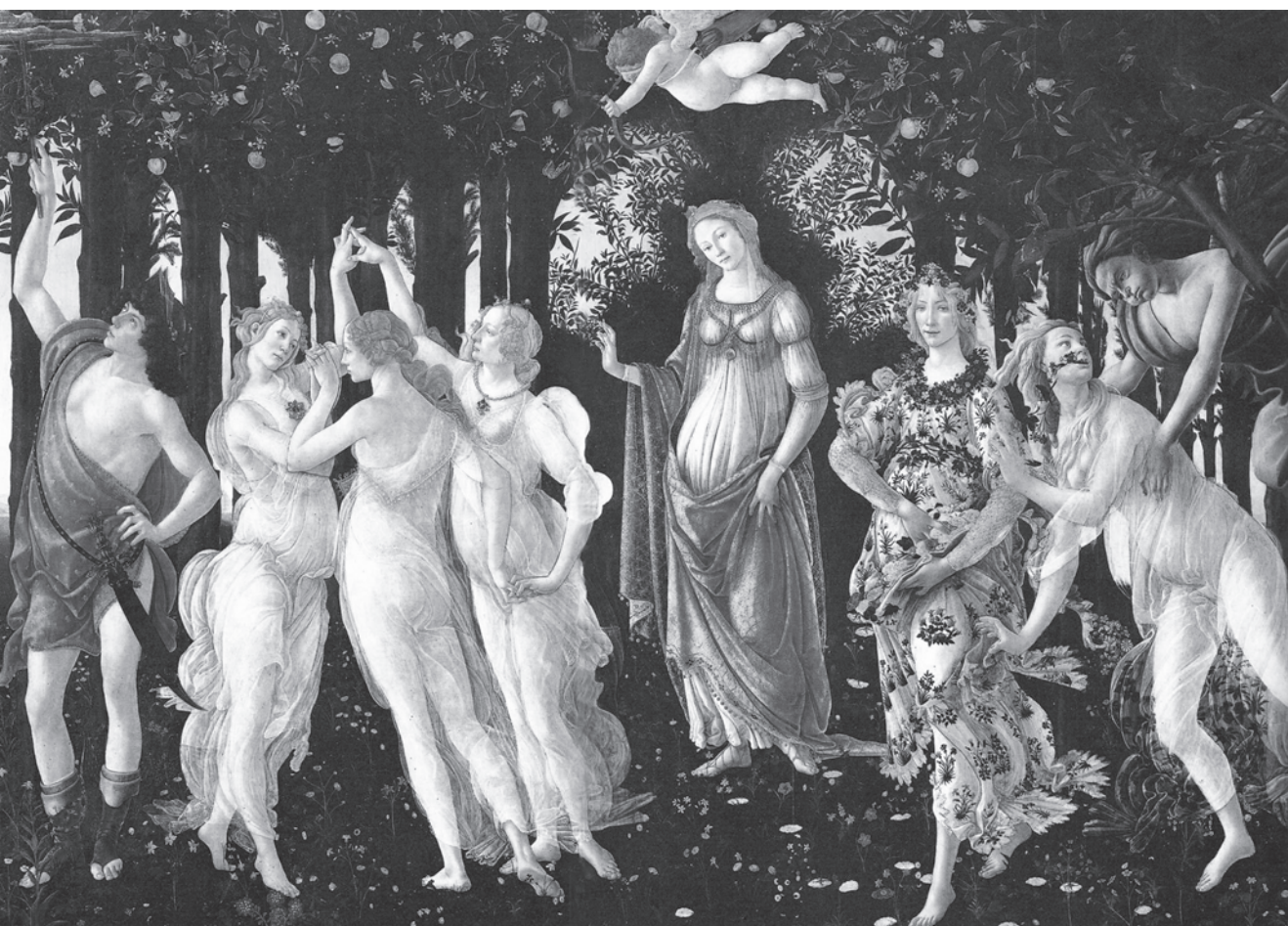
La primavera, Sandro Botticelli, temple sobre tabla, 1477-1482.

La Florencia del siglo XV nos dejó a uno de los más renombrados hombres del Renacimiento: Alessandro di Mariano di Vanni Filipepi, mejor conocido como Sandro Botticelli. El ideal platónico de unificar la belleza, el amor y la verdad prevaleció en la corte de los Médicis, quienes impulsaron la producción de obras artísticas de gran calidad en la manufactura, la técnica y la composición, como lo muestran La Primavera y el Nacimiento de Venus de este pintor: la belleza idealizada, refinada y poética, llena de alegorías y de virtudes humanas, con líneas sinuosas y caprichosas, de estos cuadros, contrastaba con el realismo de la época desarrollado por Masaccio y continuado por Leonardo Da Vinci.