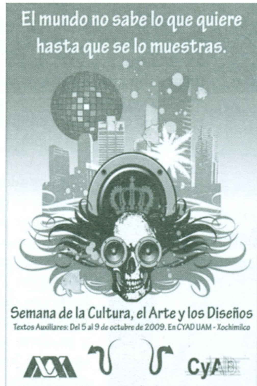
Carteles ganadores del segundo lugar