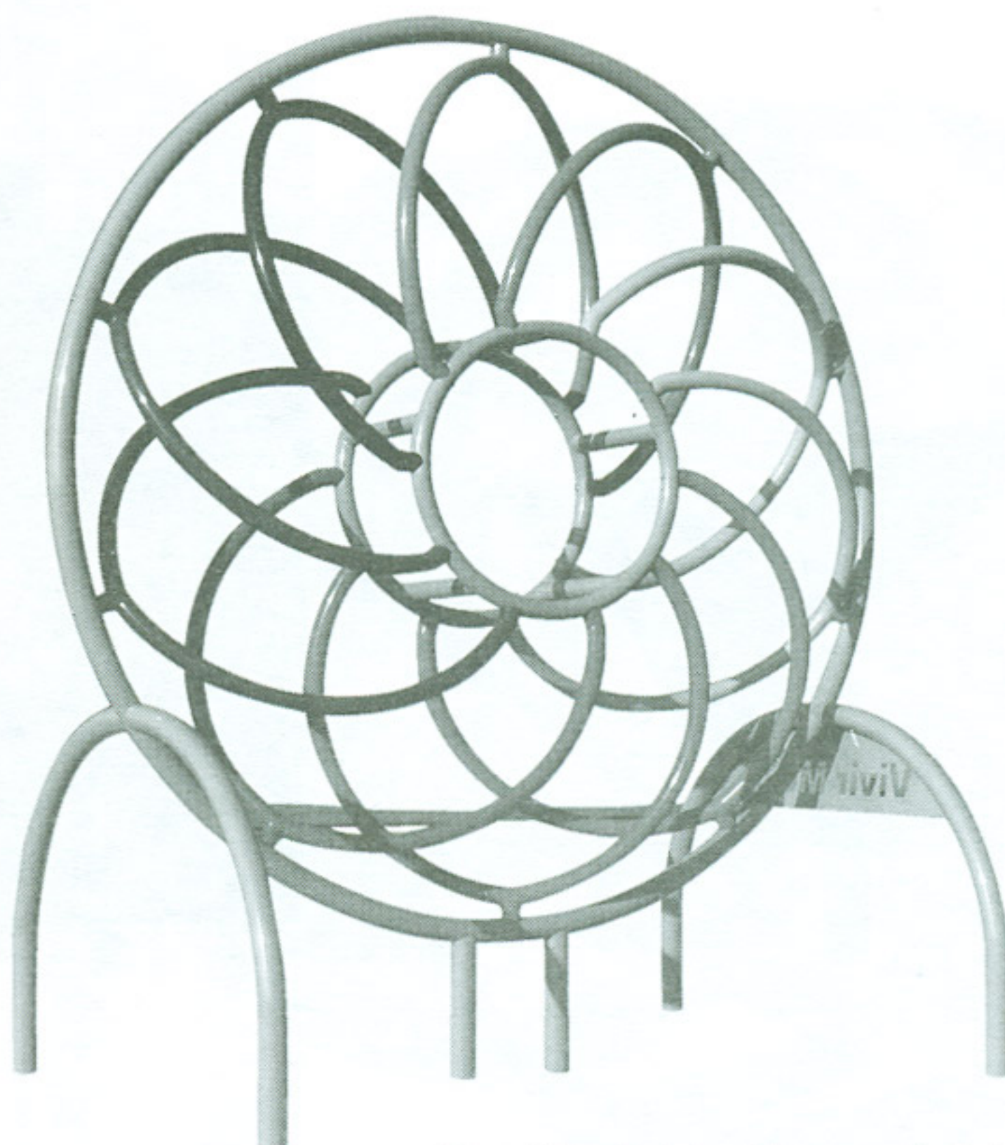
Objeto Lúdico. Diseñado y fabricado por Diseño Neko, instalado en una de las plazas beneficiadas por el programa "Rescate de Espacios Públicos" de SEDESOL.