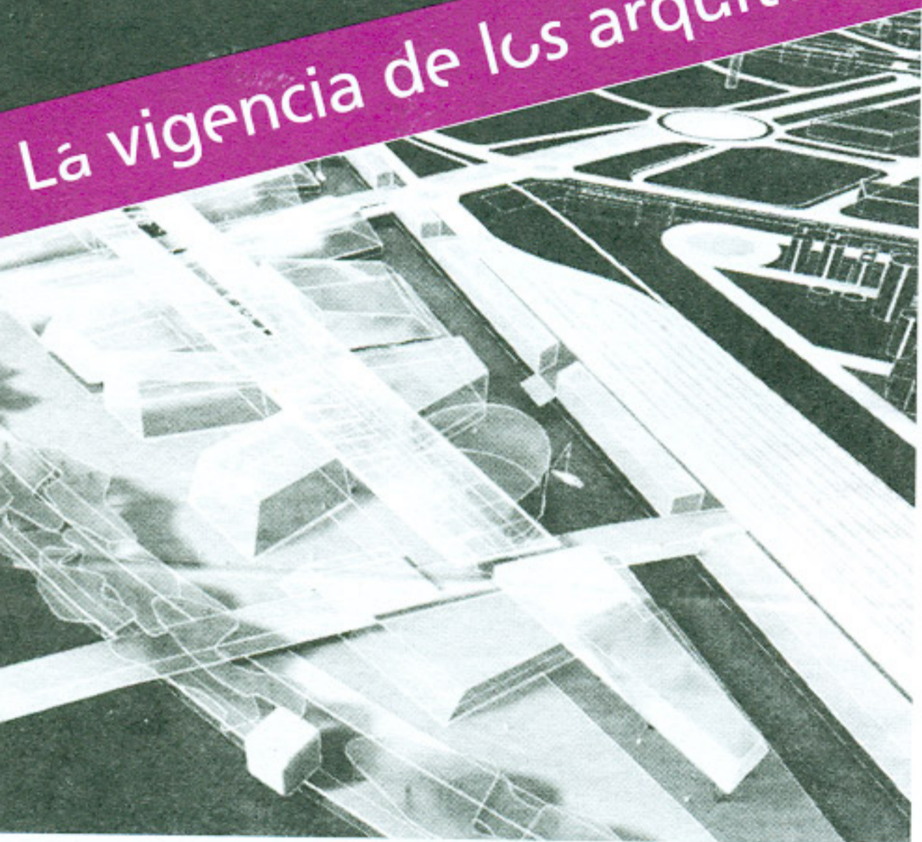
Proyecto de la Fundación Metropoli.

Las causas de su vigencia o permanencia en activo como proyectistas o como cabezas de un despacho de prestigio pueden ser varias. Desde un prestigio ganado en varias décadas de trabajo consistente, o en una capacidad de renovación que los mantiene como opción para diversas demandas contemporáneas. Cabe preguntarse entonces ¿deben ceder su espacio a las nuevas generaciones?, ¿son vigentes en sus ideas tan marcadas por la modernidad del siglo xx, en la dinámica de la nueva centuria?, ¿no hay regodeos y repeticiones de fórmulas que garantizan su permanencia en el mercado?. Las respuestas tendrán que ser específicas de acuerdo a cada caso y a la posición de quien lo juzgue, pero mientras tanto no queda más que celebrar los años vitales de Oscar Niemeyer 1 y varios más.