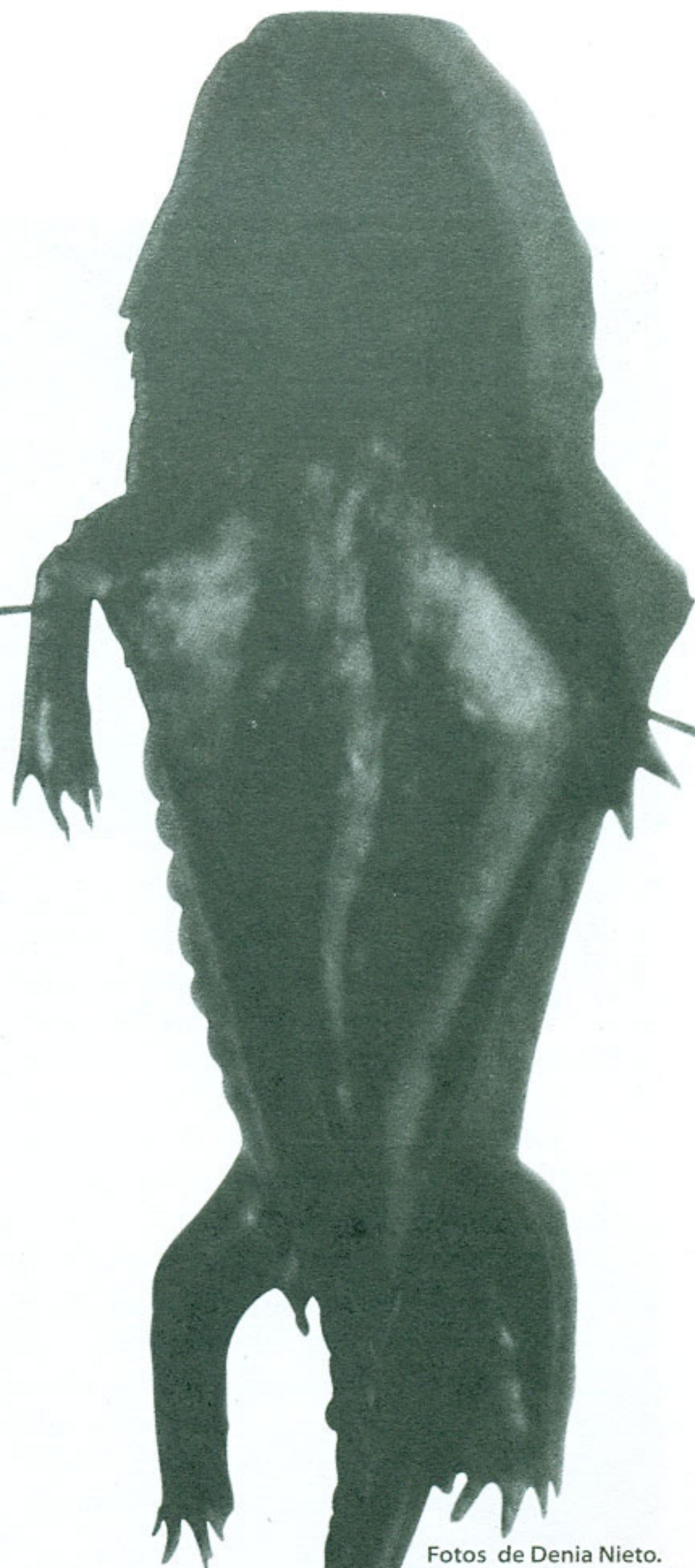
Detalles de la exposición.