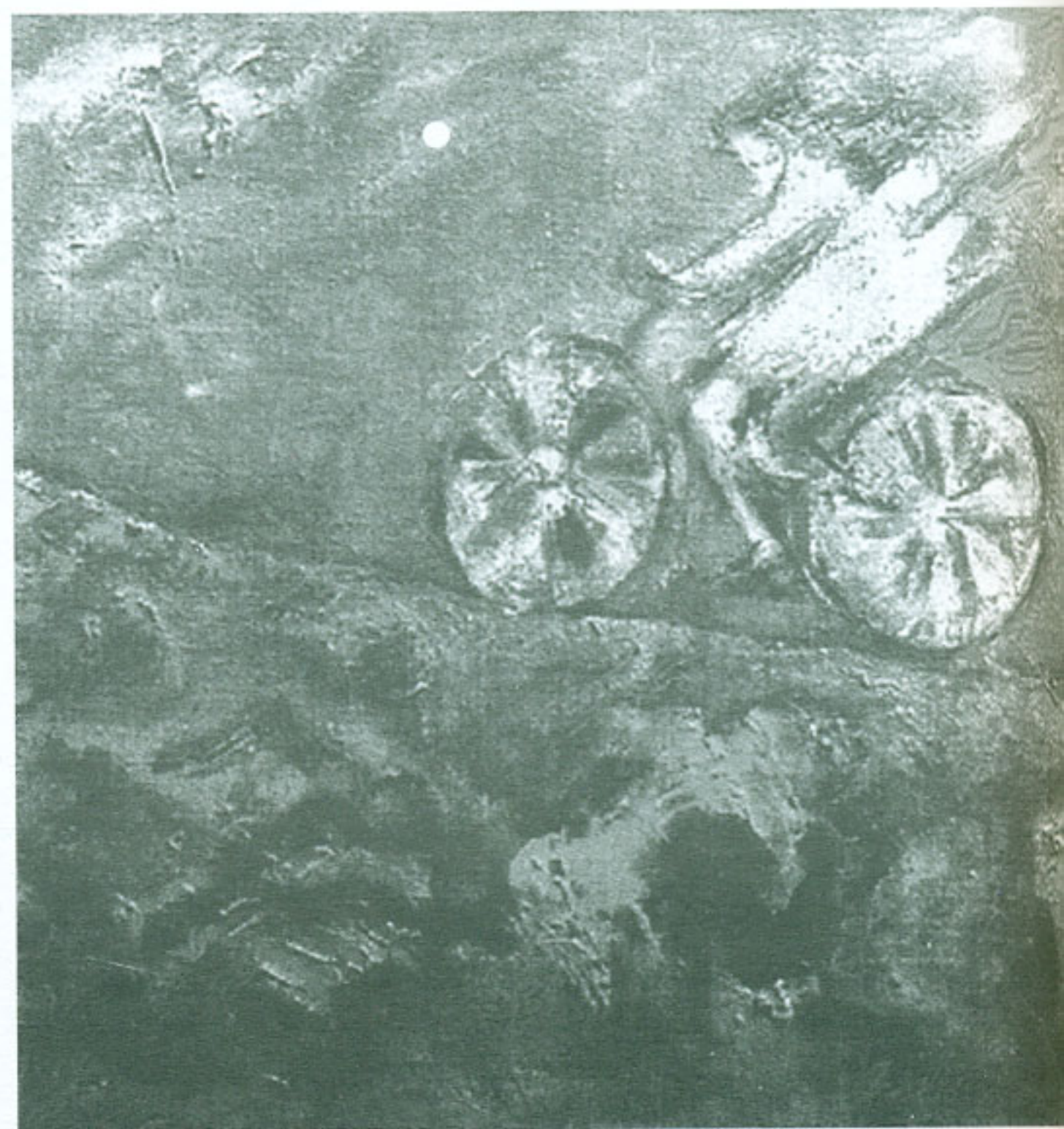
Cuesta arriba

escuela y la cerámica siempre di clases, siempre me gustó compartir con los alumnos y hacer escultura, nunca hice cosas utilitarias, menos viviendo en México donde la artesanía es importantísima.