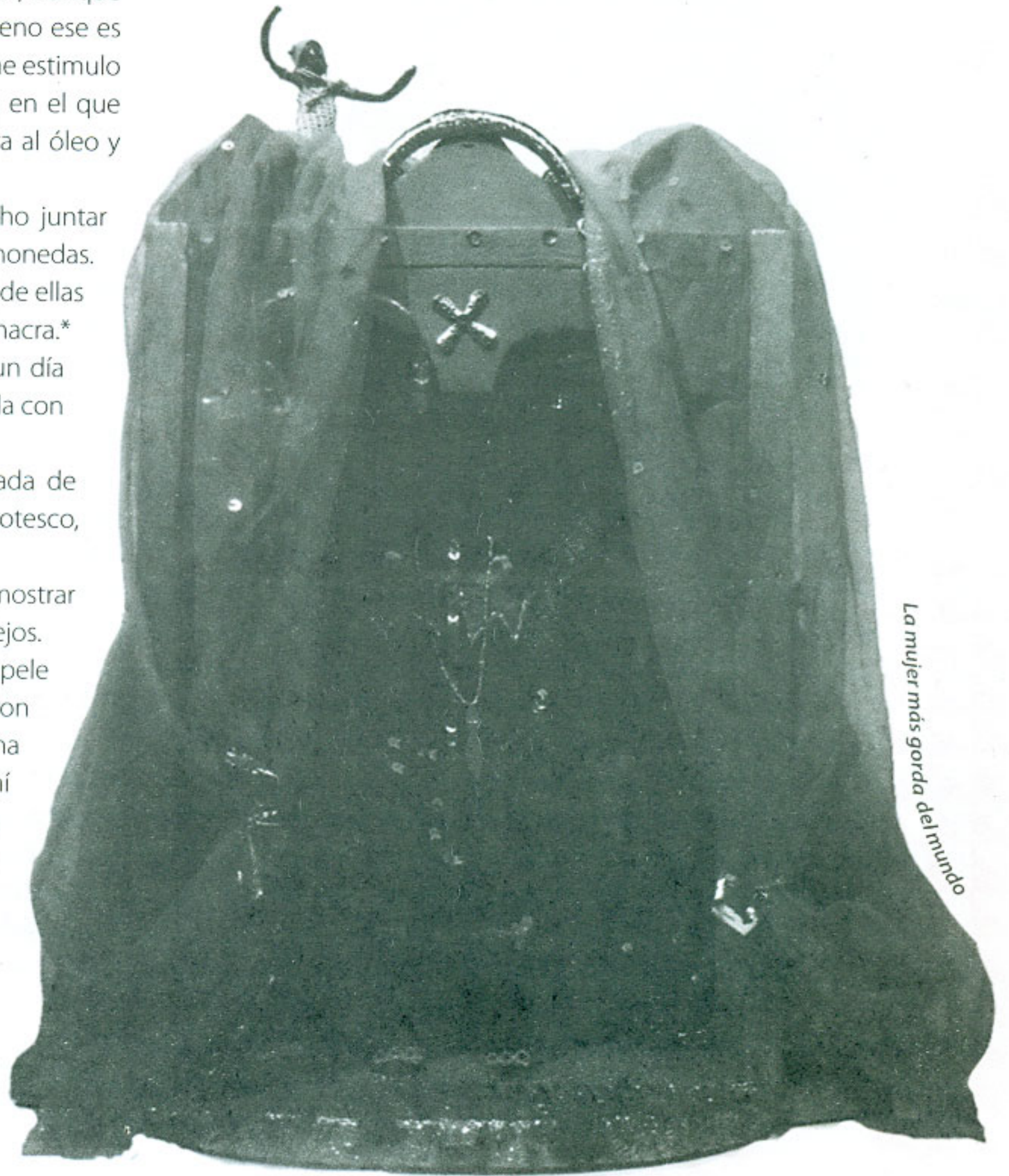
La mujer más gorda del mundo

IA-Actualmente la obra para mí es un remanso, revivir con tranquilidad, con menos angustia, ya en otra época, y me queda el mundo por delante, por hacer, y que me agarre la guadaña trabajando, por el momento hay que vivir creando.