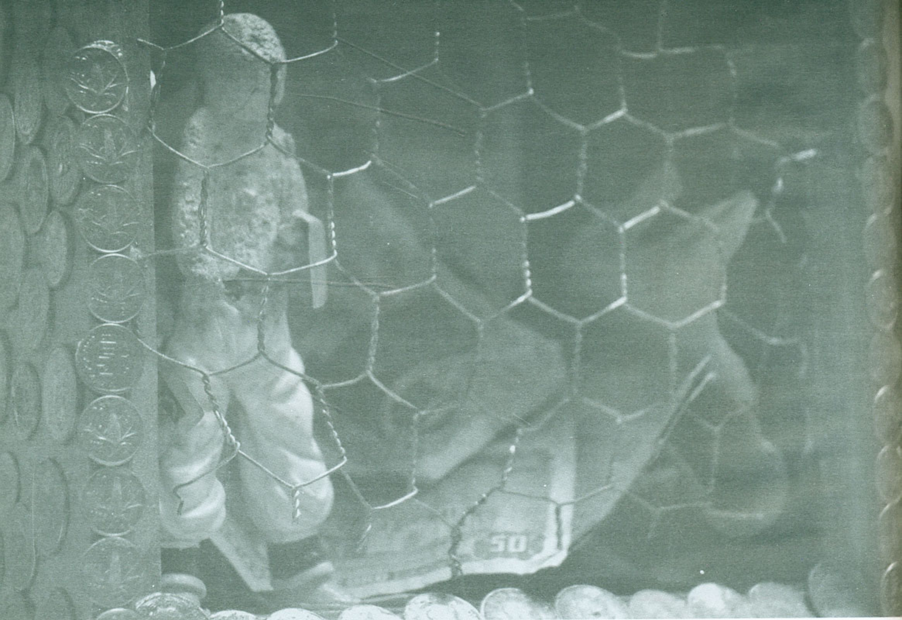
Detalle de El dinero , Foto: Viridiana González

VG-¿Por qué el uso de los materiales con los que trabajas en pintura al óleo y por otro lado la cerámica?