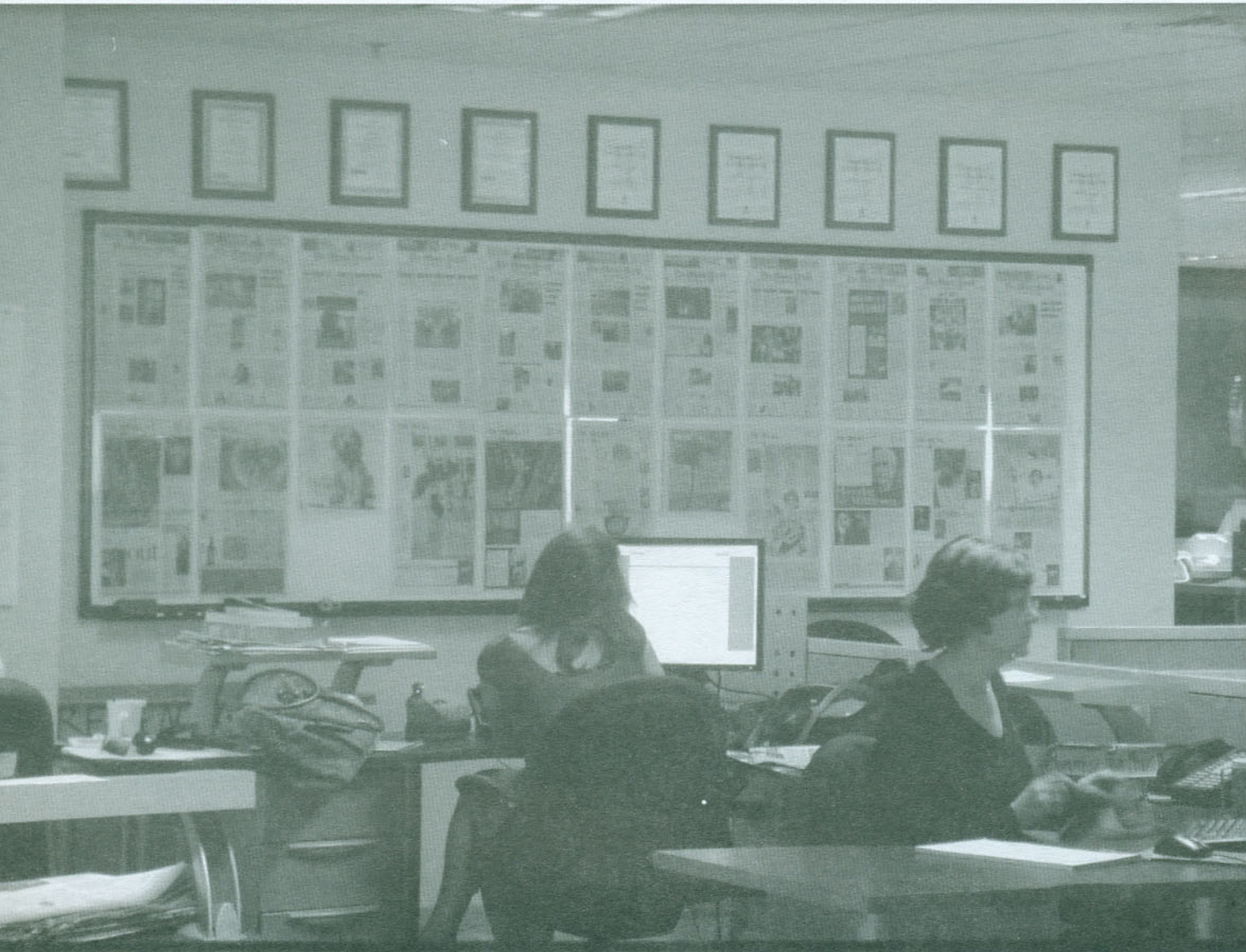
Redacción del periódico The Miami Herald