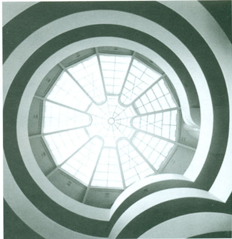
Museo Guggenheim (Nueva York) Abril 2006