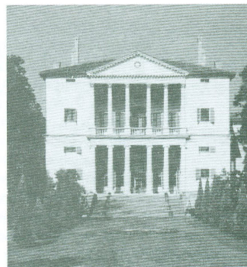
Figura 1. Villa campestre de Palladio.

Esta forma de concebir la arquitectura de la casa, como un templo o un monumento, ha predominado sobre la otra más pragmática y realista, aquella que busca conocer la vida cotidiana de los usuarios en las viviendas, sus modelos de uso de espacio habitable, los cambios en el tiempo entre la relación espacio habitable y familia, entre otros. El tema no ha dejado de ser un pretexto para plasmar la escultura espacial por encima del espacio habitable.