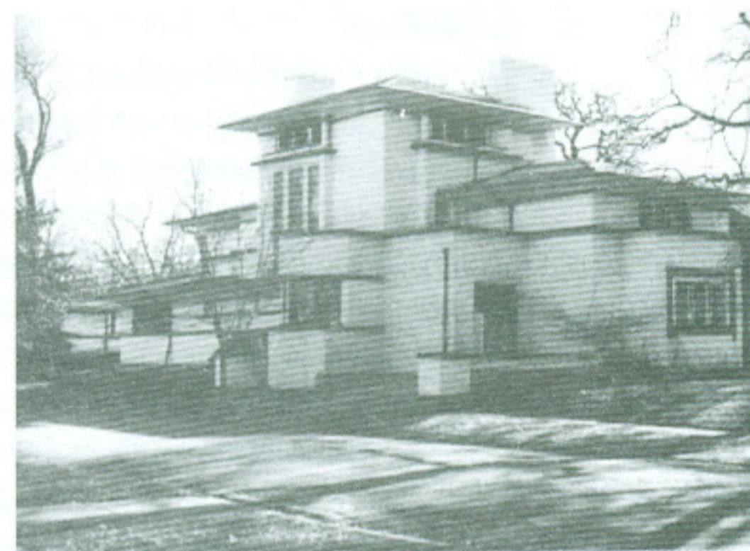
Figura 2. Prairie house de Frank Lloyd Wright