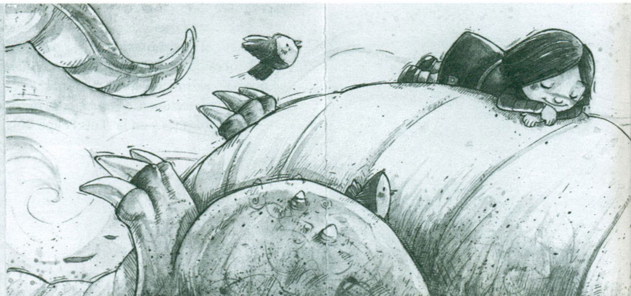
ILUSTRACIÓN DE CARLOS VÉLEZ / EL ILUSTRADERO