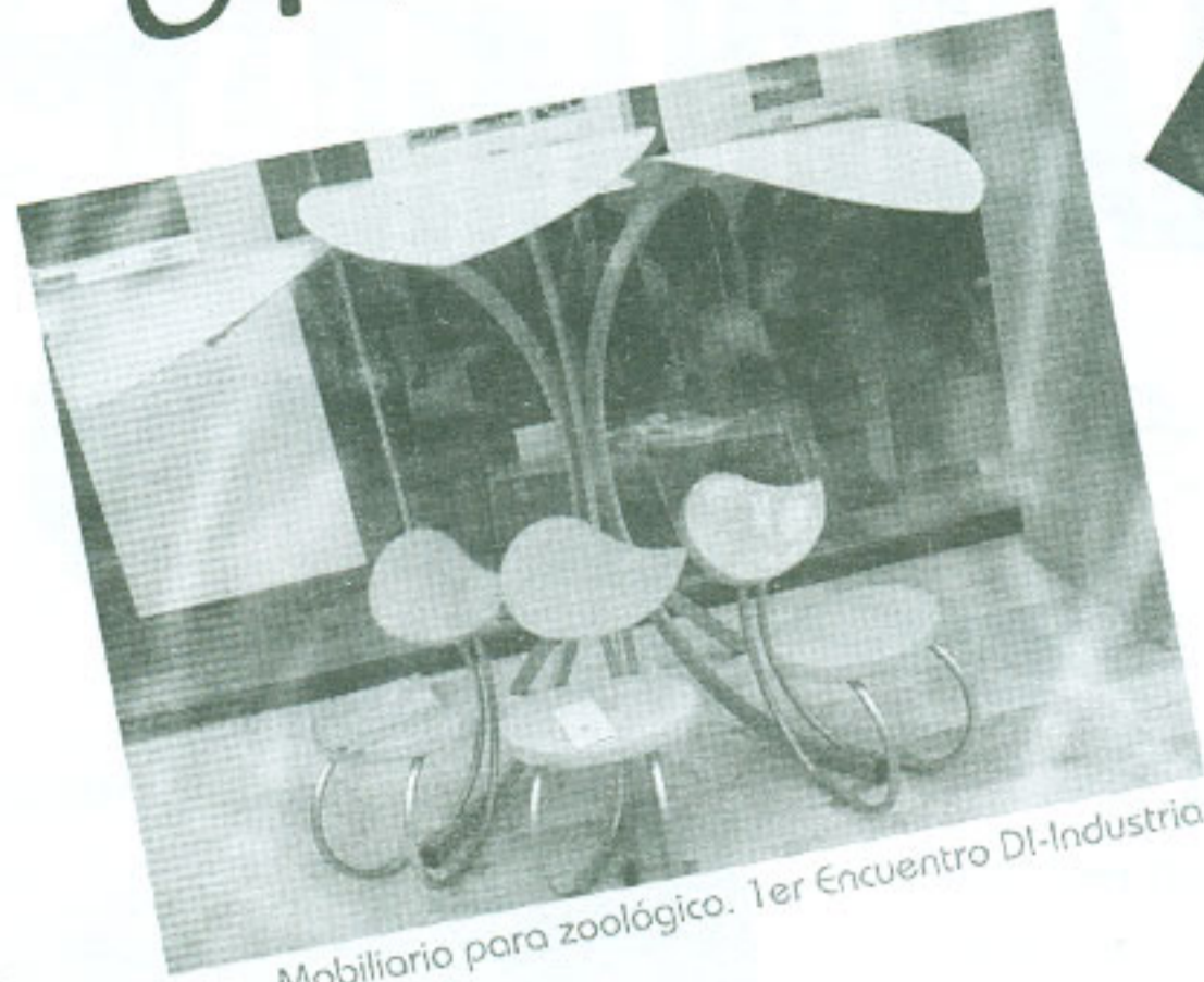
Mobiliario para zoológico. 1er Encuentro DI-Industria.