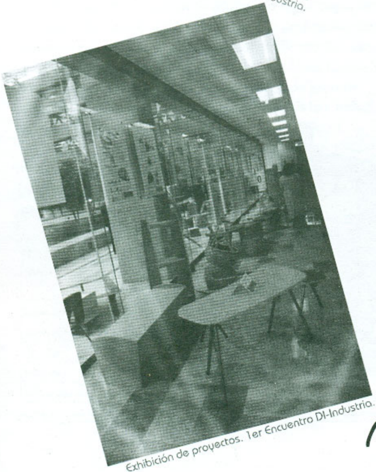
Exhibición de proyectos. 1er Encuentro DI-Industria.

Mobiliario para el aprendizaje infantil, joyería en plata, exhibidores publicitarios, vitrinas museográficas, mobiliario para zoológicos, sillas infantiles, triciclos, cuatriciclos, scooters , sistemas de rehabilitación física, mobiliario para viviendas de interés social, son algunas de las piezas que estuvieron a disposición total de los asistentes, ya que no sólo podían observar los diseños, incluso podían hacer uso de cualquiera de ellos.