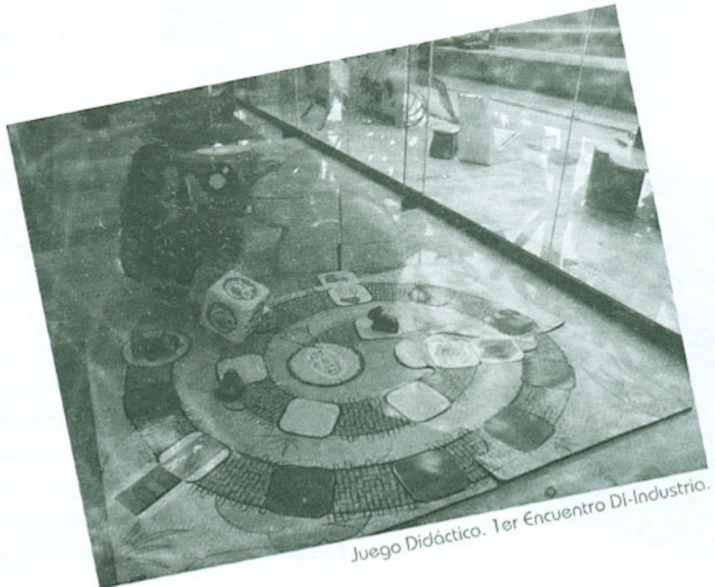
Juego Didáctico. 1er Encuentro DI-Industria.