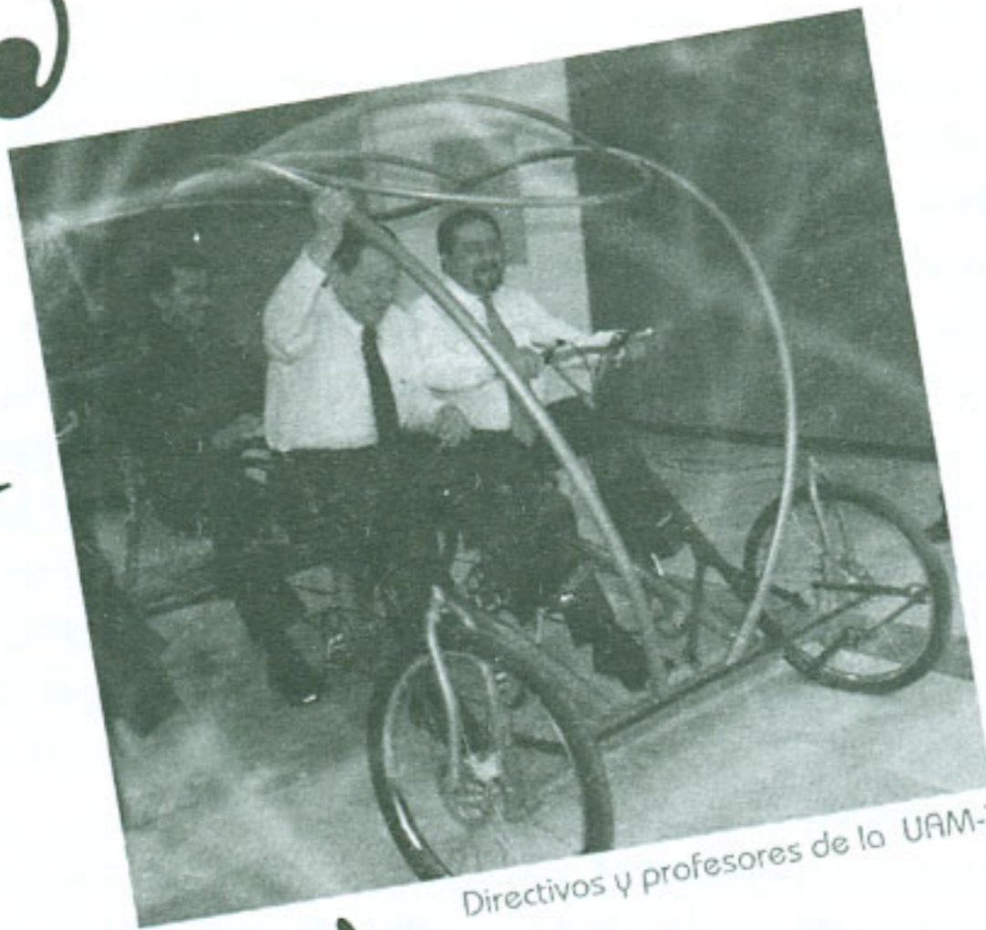
Directivos y profesores de la UAM-X

El pasado 24 de julio, estudiantes, maestros, alumnos y público diverso vivieron un día lleno de diseño industrial. Todo comenzó con la original llegada de los profesores en un cuatriciclo, diseñado por un alumno, a la galería principal de la Rectoría de la UAM, sede del encuentro. Este detalle realmente me hizo sentir el gran compañerismo que se vive entre alumnos y profesores de Diseño Industrial.