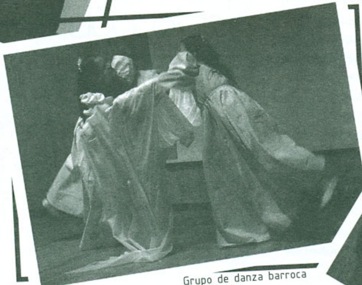
Grupo de danza barroca