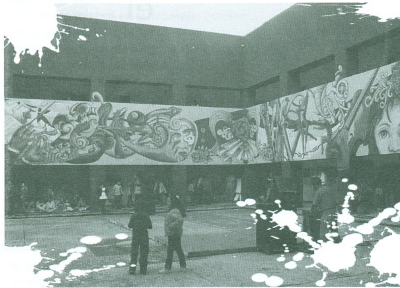
Fragmento del mural Yolotlapalzintzin

EL NIÑO, LOS SUEÑOS, EL ARTE, LA LIBERTAD Y EL AMOR SON PALABRAS QUE EN ESENCIA ESTÁN PRESENTES, Y POR SUPUESTO EL COLOR Y EL ALMA