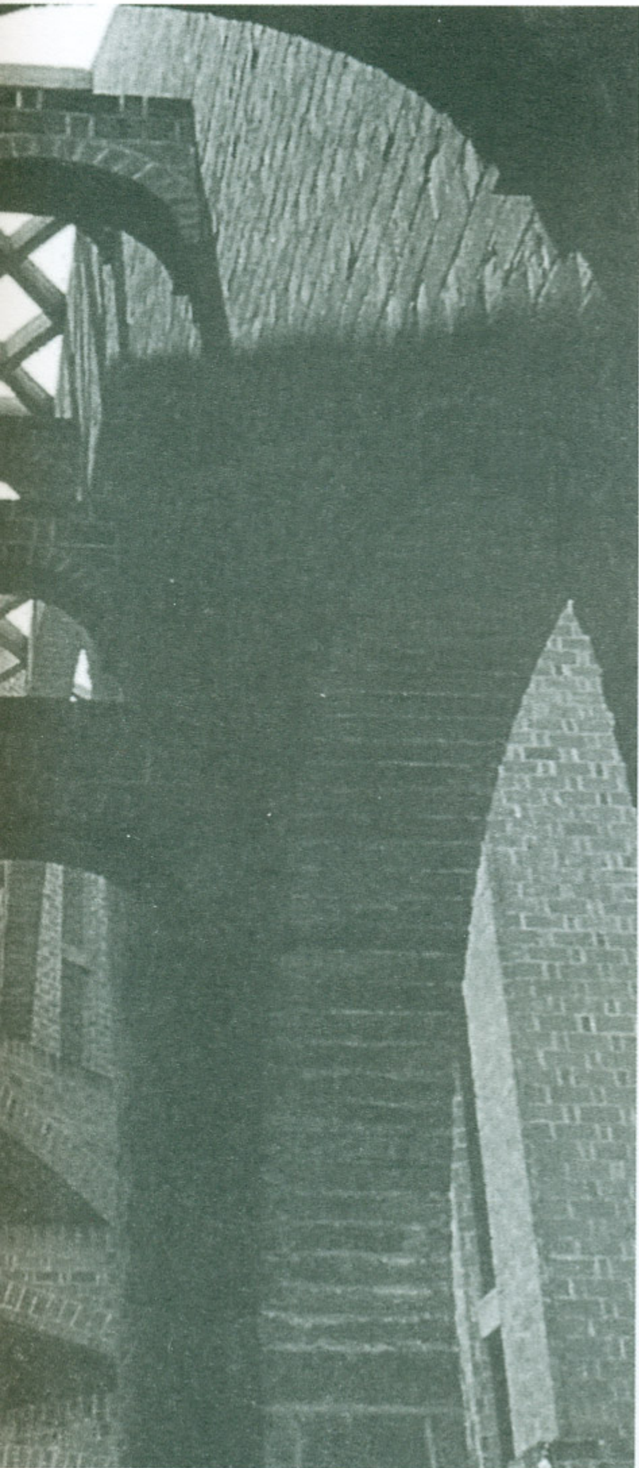
Parroquia del Perpetuo Socorro, Ciudad Hidalgo, Michoacán