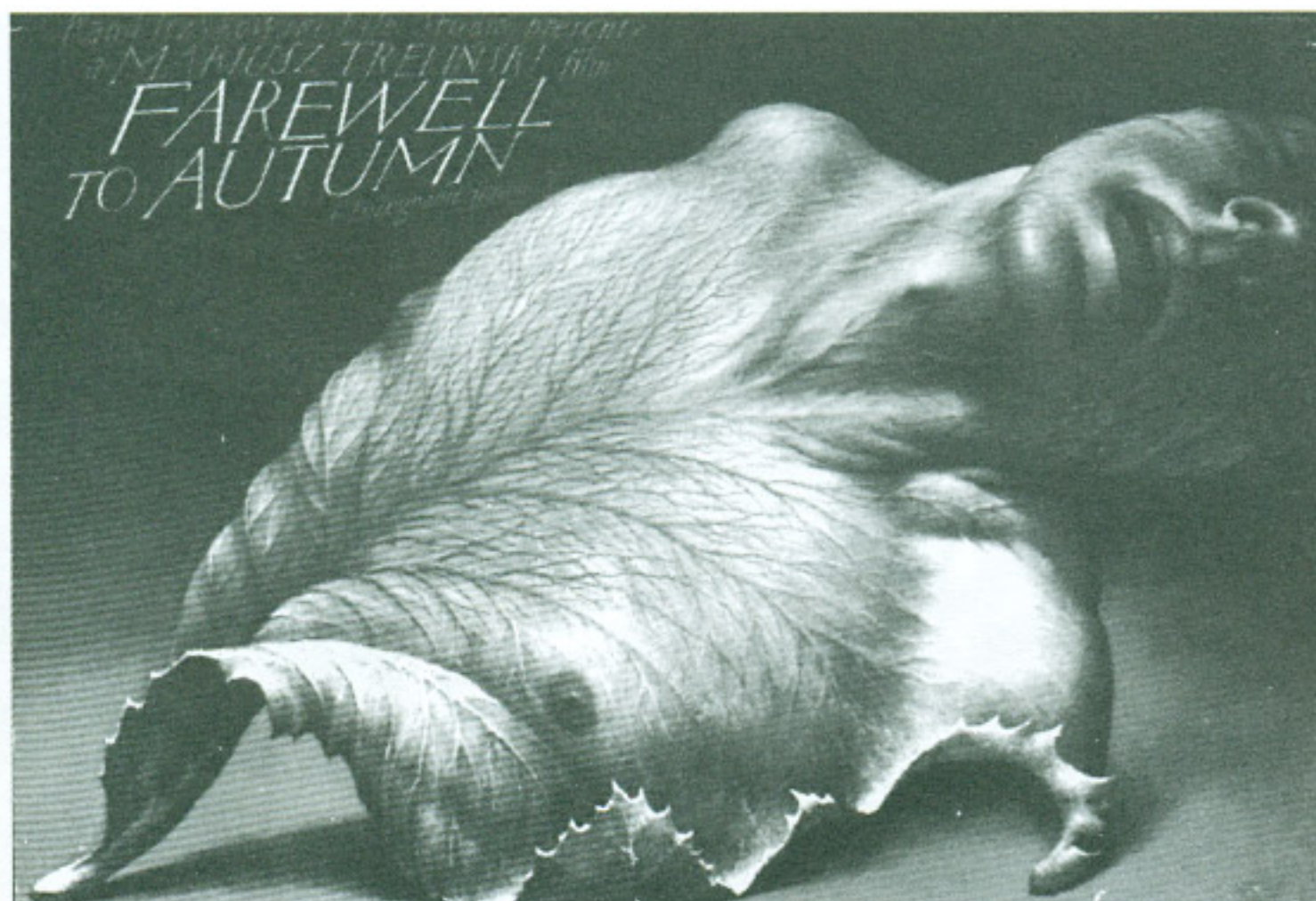
Wieslaw Walkuski Pozegnanie jesieni La despedida del otoño Cartel de cine