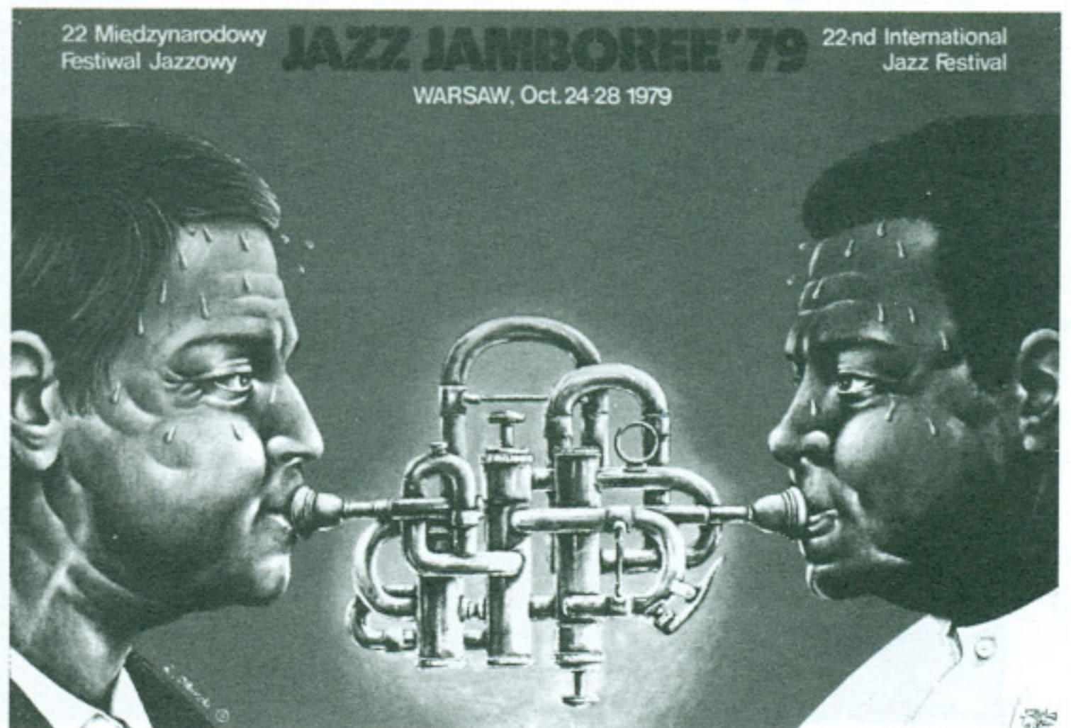
Rafał Olbinski Jazz Jamboree Cartel musical