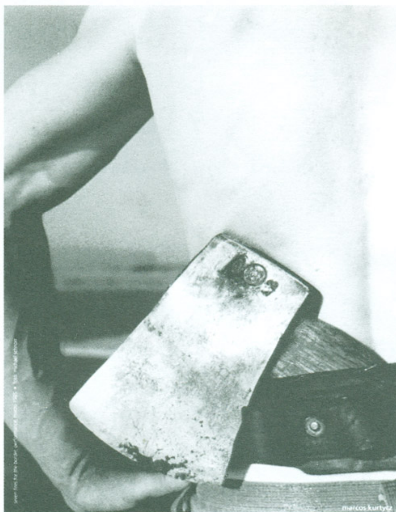
Seven fires for the border , performance, 1985.