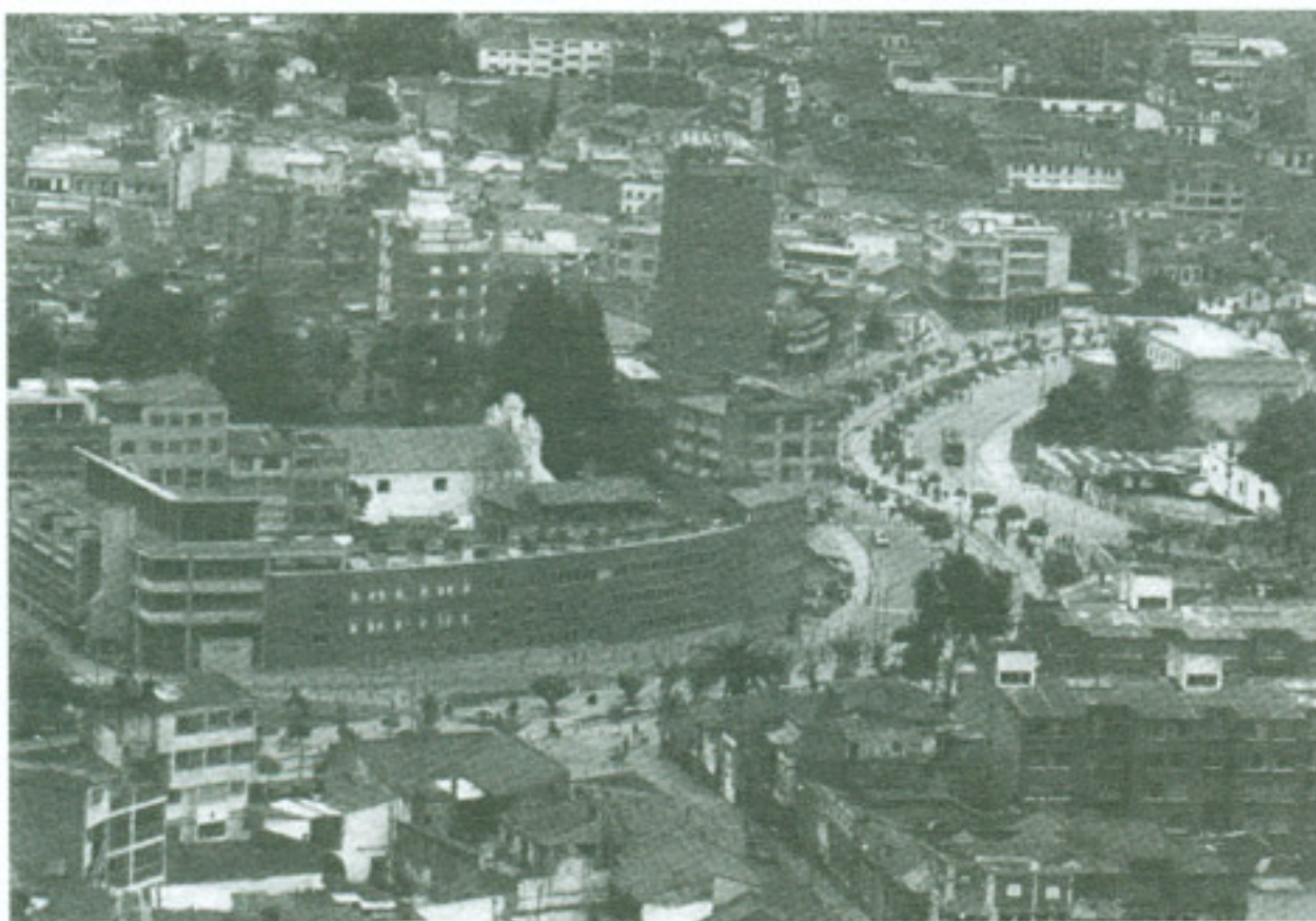
Avenida Gonzalo Jiménez, Bogotá, 1999-2000.

de la propuesta. Y encontramos también la Casa en Río Frío , en donde frente a la horizontal se construye una topografía que da un nuevo sentido al esquema de los patios.