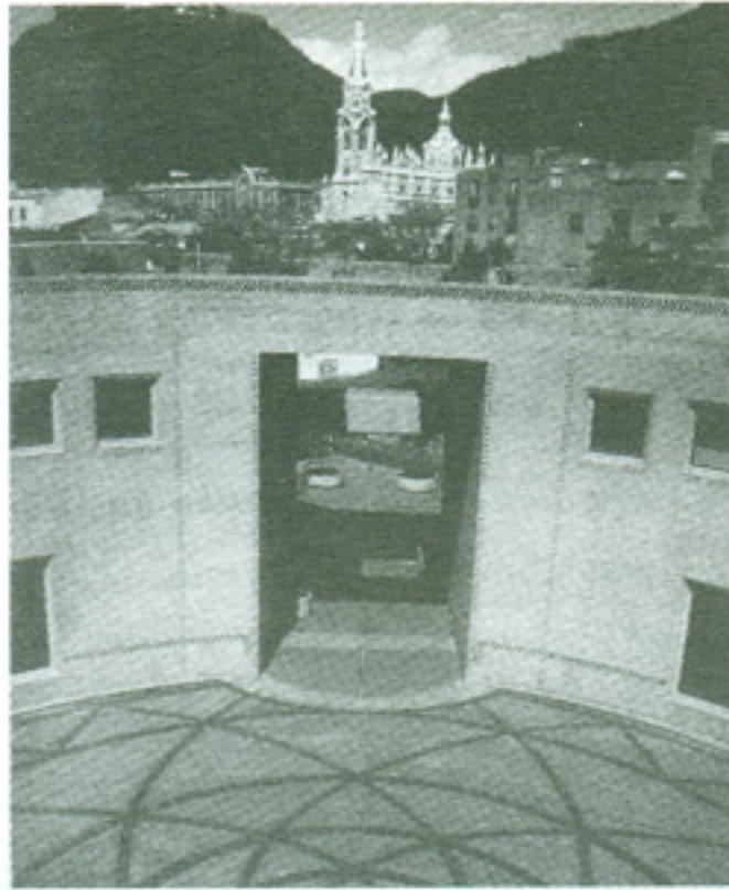
Archivo General, Bogotá, 1988-1994.