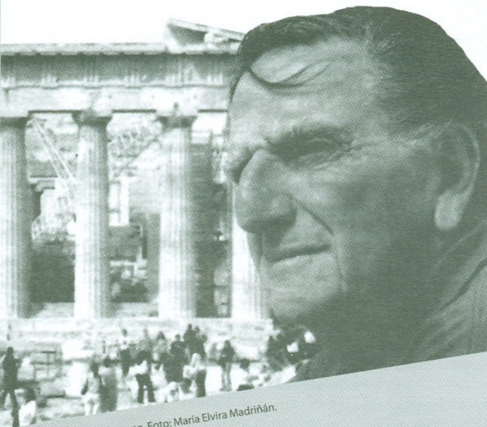
Rogelio Salmona

Crear espacios que posibilitan el sentido de comunidad manteniendo individualidades subrayadas y el espacio común, que se torna en un lugar de encuentro con la gente y el paisaje, son algunas de las características de la obra del arquitecto Rogelio Salmona.