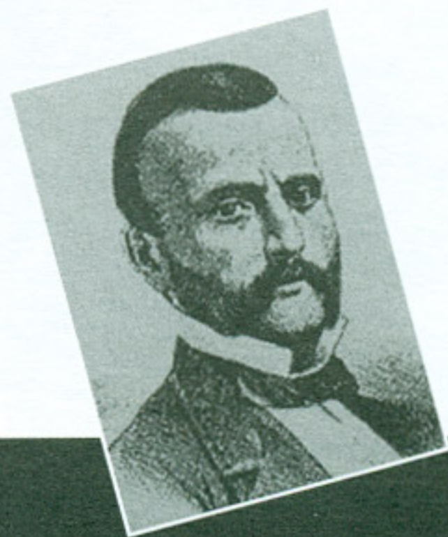
Miguel Lerdo de Tejada

En la lógica de la época, y ante los ojos de los grupos liberales, se creía que la aplicación de la ley y la consecuente desamortización traerían el progreso económico. Se pensaba que si se convertían en dueños, los antiguos arrendatarios mejorarían la tierra y harían inversiones en su recién adquirida propiedad. Se deseaba crear una clase media y con ello una base social, requerida especialmente por el movimiento liberal, que era minoritario. Al