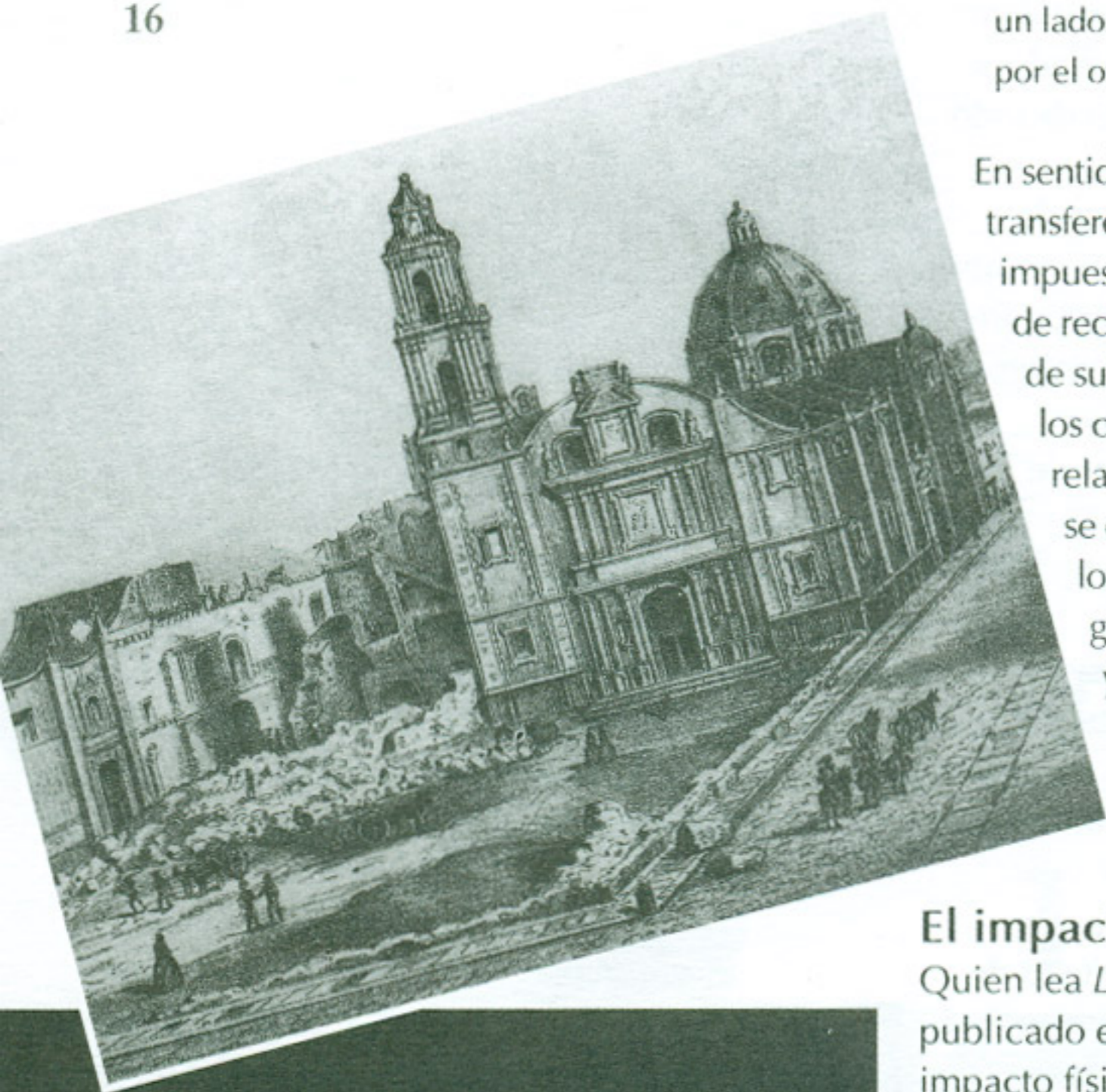
Plaza de Santo Domingo hacia la década de los años sesenta del siglo XIX