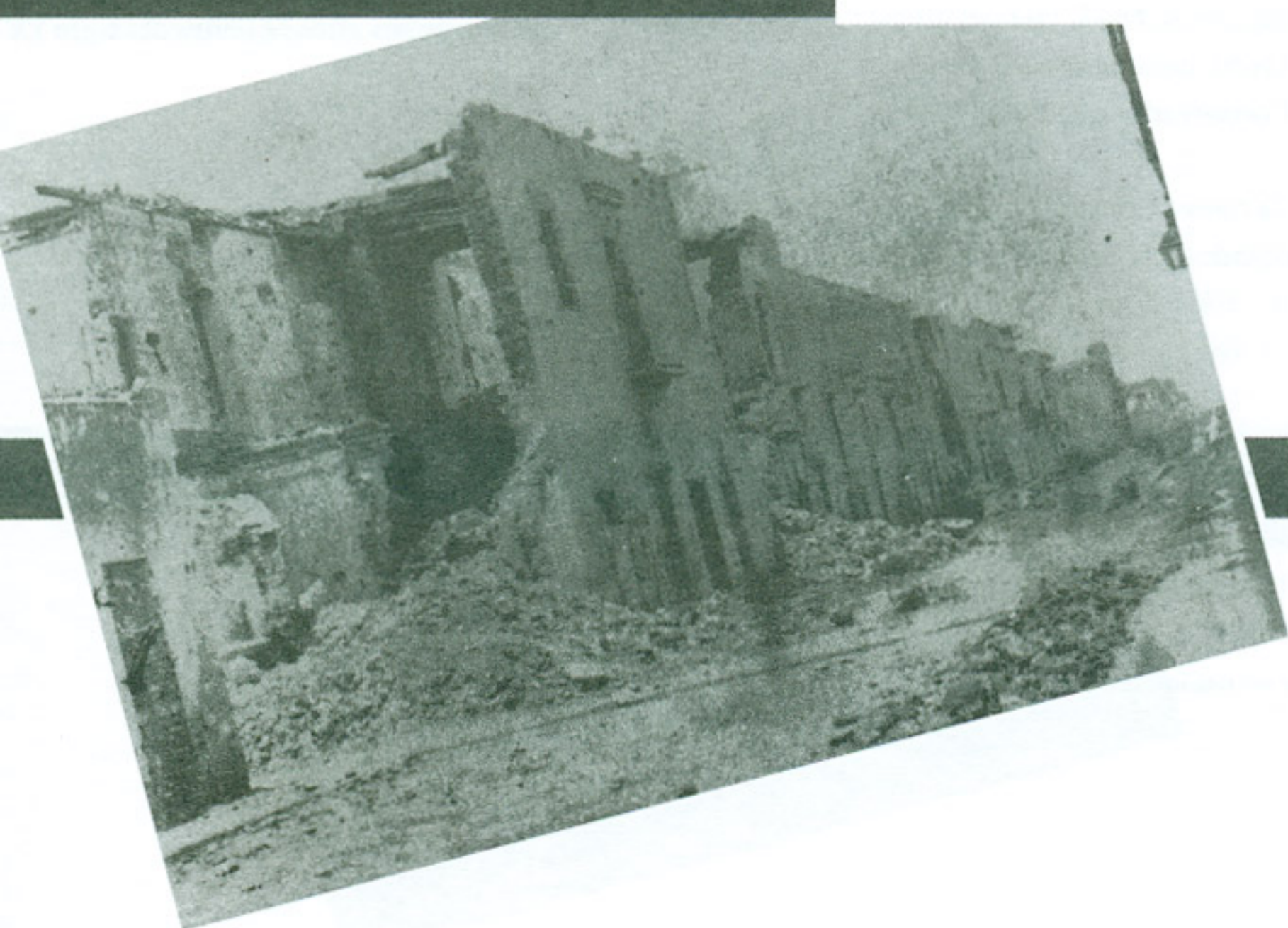
Convento de San Francisco

Estas disposiciones se agruparon con el nombre de “Código de la Reforma” y en él se incluyeron las disposiciones administrativas y legales, adicionales a las propias Leyes de Reforma ( Ley de Desamortización de Fincas Rústicas y Urbanas, Ley de Remuneraciones Parroquiales, Ley de excomunión de Monjas y Frailes y de extinción de corporaciones eclesiásticas, Ley del matrimonio civil, Ley de Registro Civil y secularización de cementerios, Ley de limitación de días festivos y prohibición de asistencia oficial a ceremonias religiosas por funcionarios públicos,