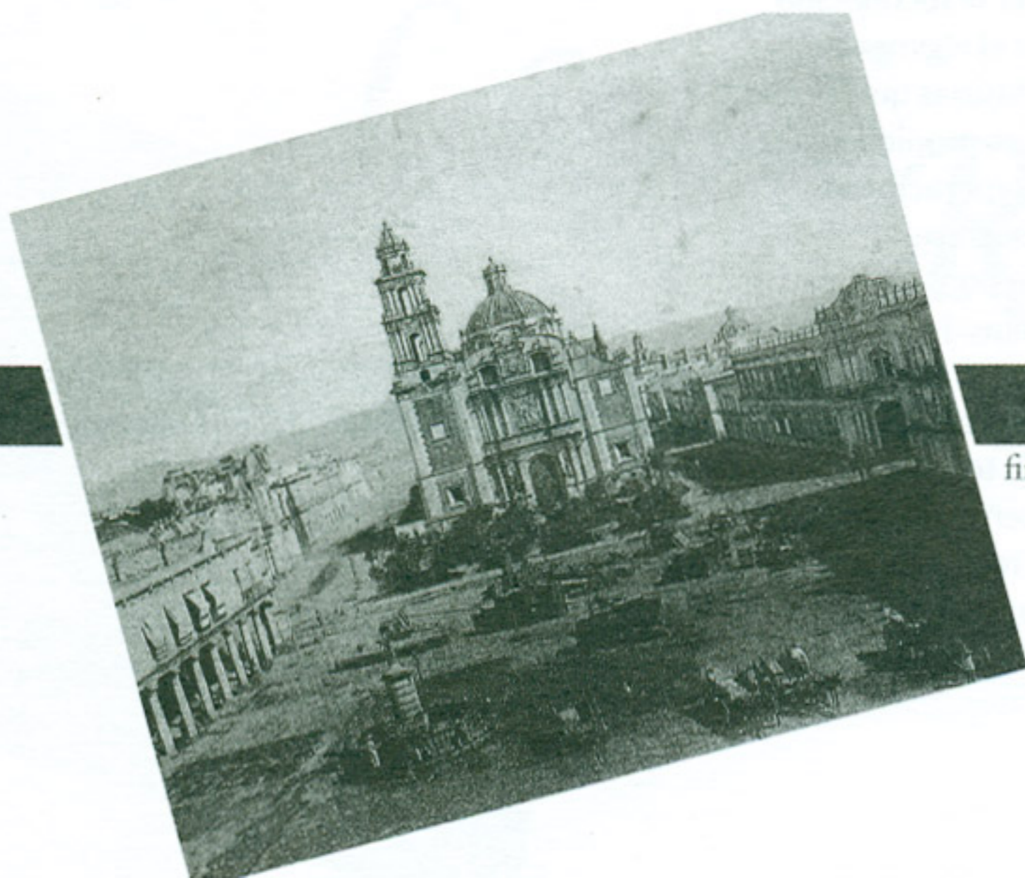
Plaza de Santo Domingo finales del siglo XIX