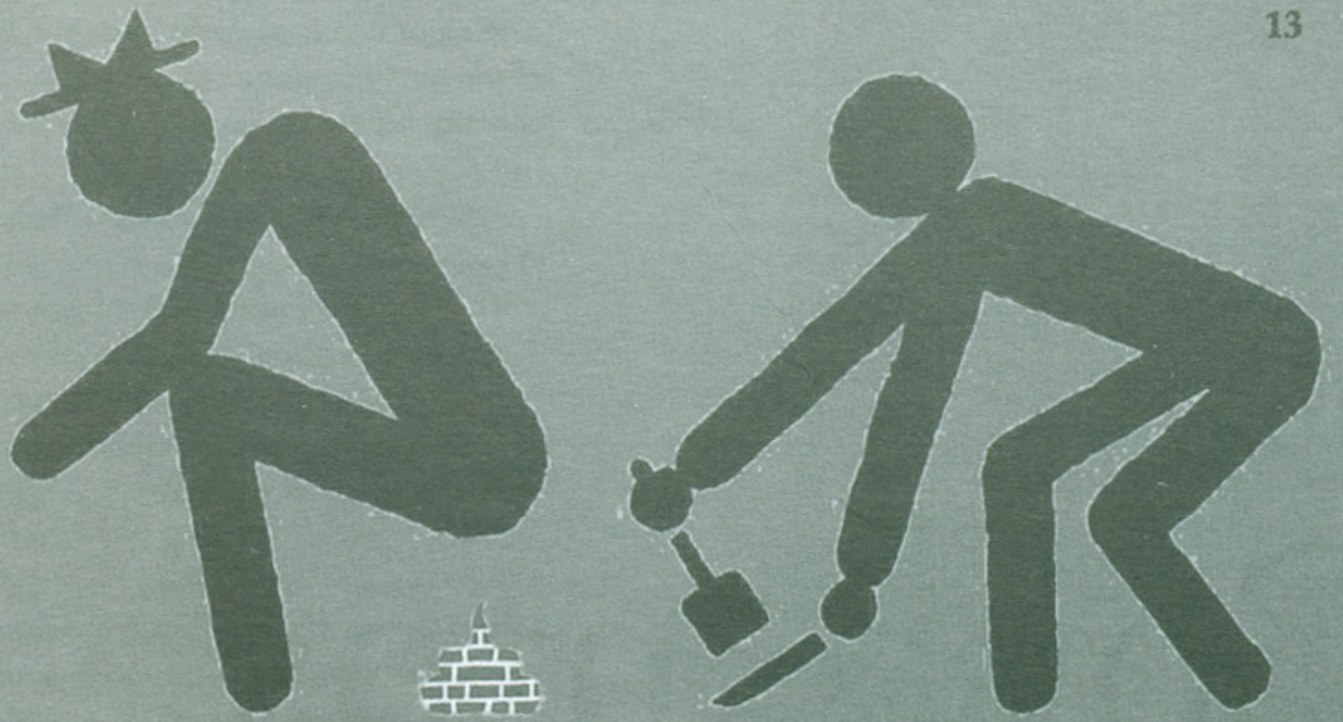
Ilustración de Daniel Patiño a partir de carteles de Isidro Ferrer.

Hay veces en que tropiezo con las ideas, otras surgen como accidentes geográficos, las más están delante de mis narices y he de escarbar para descubrirlas. Algunas provienen de la verbalización de los problemas, se mueven en el terreno de las palabras y toman corporeidad cuando las nombro, cuando consigo definirlas semánticamente. 1