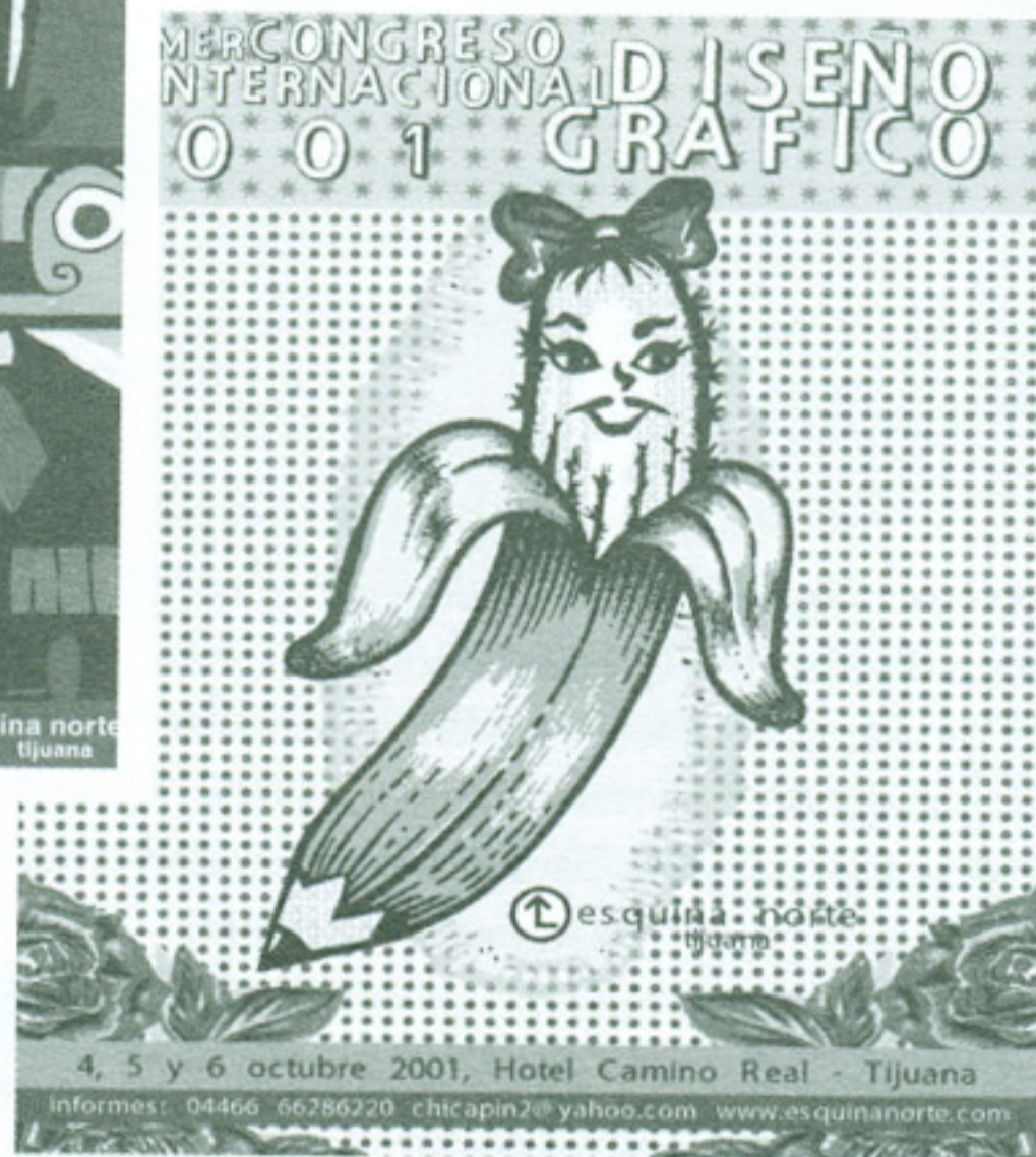
Cartel promocional del 1er Congreso Internacional de Diseño Gráfico Esquina Norte