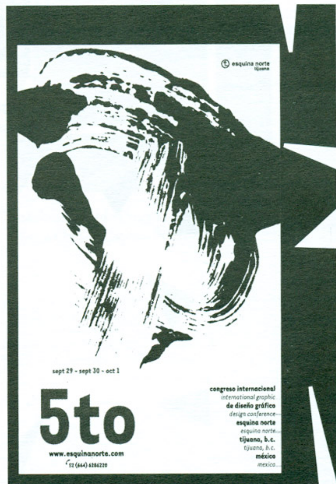
Cartel Promocional del 5to Congreso Internacional de Diseño Gráfico Esquina Norte

"El proyecto más importante y el que más adoro es el Congreso Internacional Esquina Norte... He aprendido muchísimas cosas de él: creer en mi trabajo,