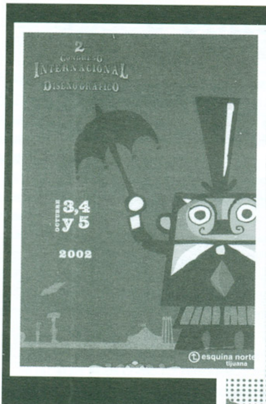
Postal del 2do congreso