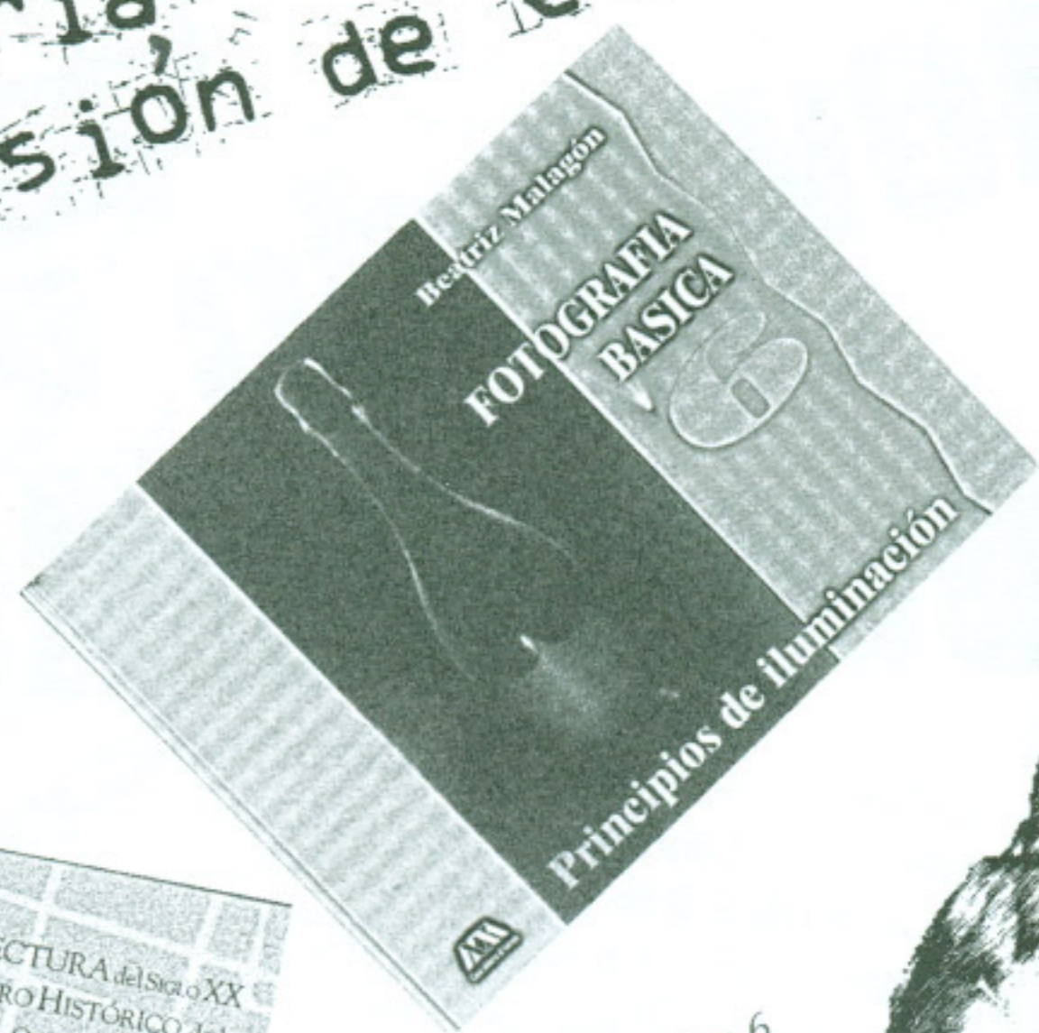
Fotografía básica 6 de Beatriz Malagón

Arquitectura del siglo XX en el Centro Histórico de la ciudad de México, de Rodolfo Santa María