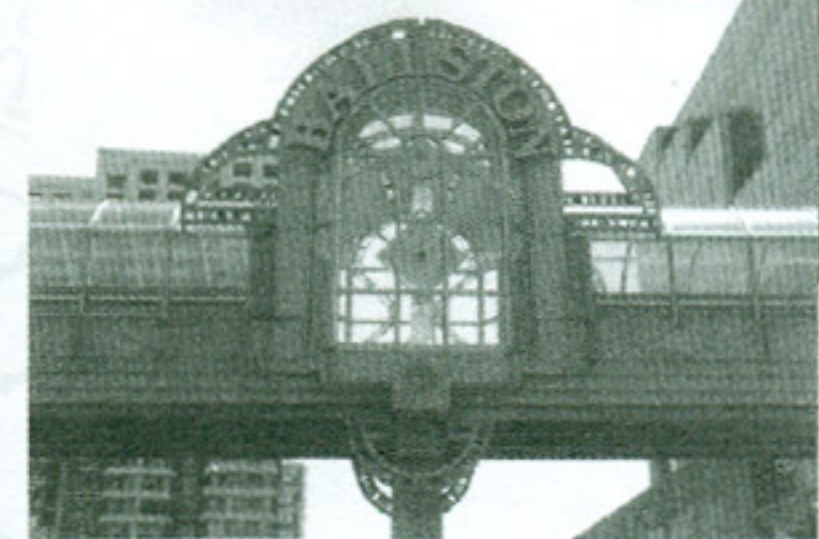
Ballston Pedestrian Bridge