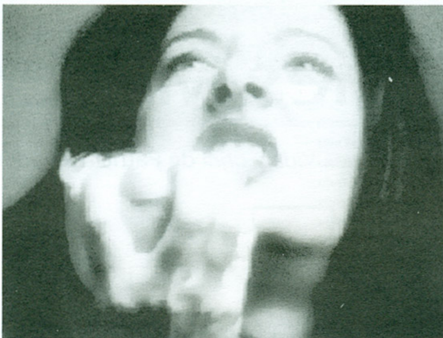
The onion, 1996, Marina Abramovic

Aunque Wolffer es mucho más joven que Abramovic, su trayectoria la consolida internacionalmente como una de las más importantes y reconocidas artistas mexicanas de performance, basta recordar Looking for the perfect you (1993), performance en el que Wolffer descalza y portando un ligero vestido de novia, enterró el velo blanco ensangrentado en la nieve de un estacionamiento en Québec, o Territorio mexicano (1996-1997), en el Carrillo Gil, en el que durante cuatro horas estuvo desnuda sobre una mesa quirúrgica y atada fuertemente a ella de pies y manos, recibiendo el impacto continuo de gotas de sangre sobre el vientre, mientras una voz en off con tono policiaco insistente y tediosamente repetía "Peligro, se está acercando a territorio mexicano", y recientemente Mientras dormíamos (2002-2003), una brutal denuncia contra los asesinatos en Ciudad Juárez. Es imposible no asociar a estas dos mujeres comprometidas con su obra, con el arte en general y con la vida en particular. "El dolor llega, no es algo que busque el artista", dice Abramovic.