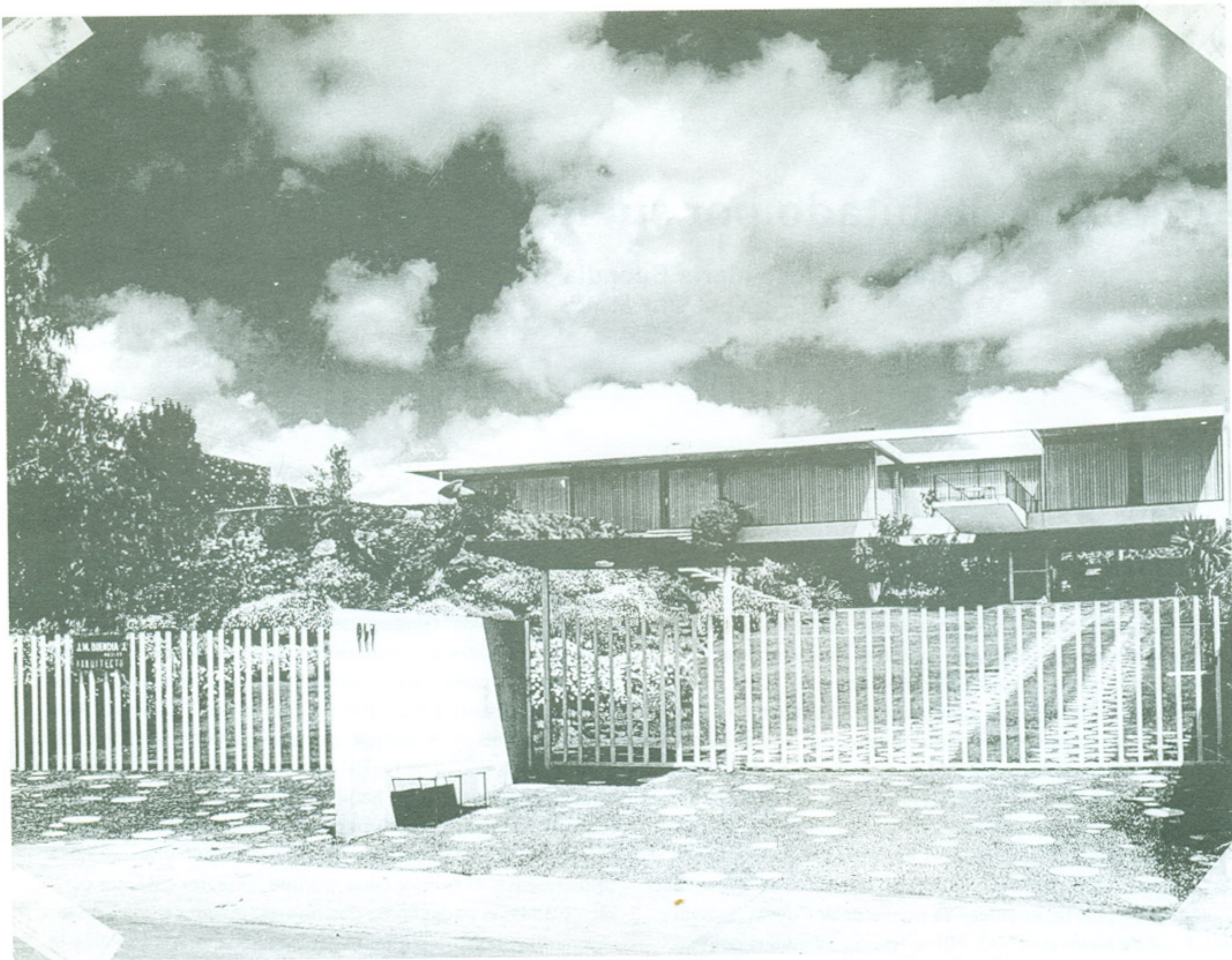
Jardines del Pedregal, 1957, Opera prima.

nerviosa muy fuerte cuando lo expulsan de Marruecos. Nos mandan a vivir, te estoy hablando de los años 1941, 1942, al otro lado del estrecho, a una ciudad que se llama Algeciras que está frente al Peñón, y ya había comenzado la Segunda Guerra Mundial, veíamos como película a la escuadra británica metida ahí en la Bahía de Algeciras y los bombardeos de los alemanes. Ahí comenzó la cacería del Bismarck.