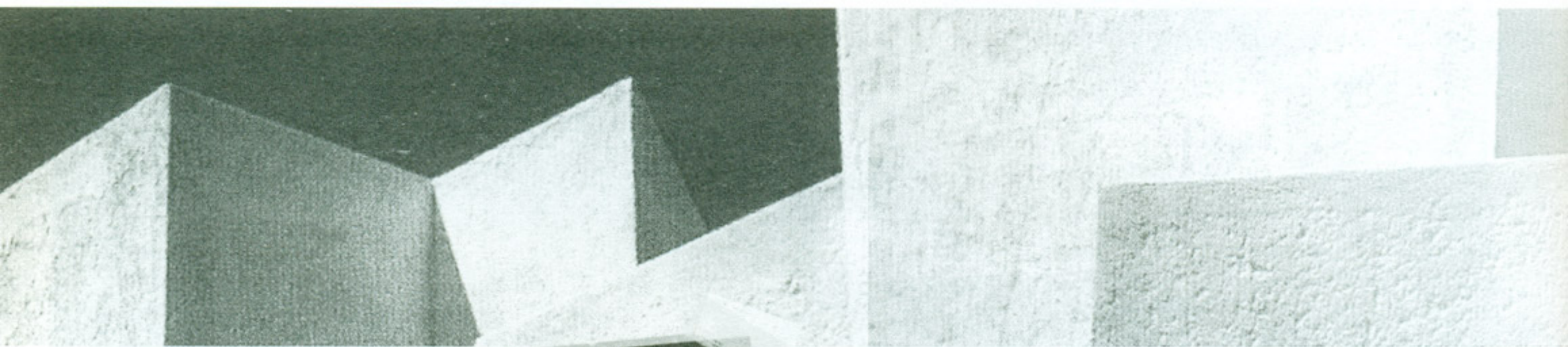
Bosques de las lomas 1978 (fragmento)