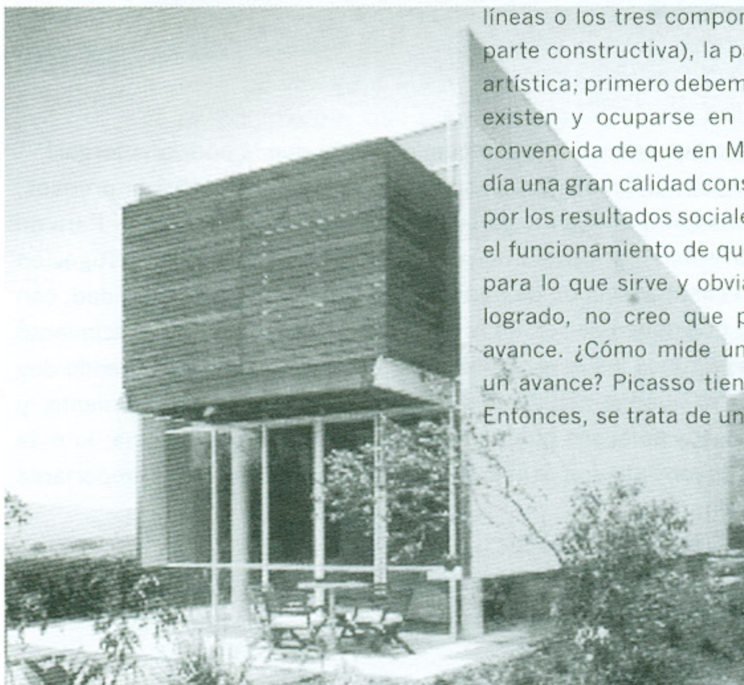
Casa Farca, Tepoztlán, Morelos, México, Arq. Daniel Álvarez

LN—Es que no sé si la palabra avanzar sea la correcta. Yo no creo que cuando se habla de ciertas disciplinas puede hablarse de un avance; no es como la ciencia donde comienza a haber un progreso porque se descubre en medicina algún medicamento, a eso le podemos llamar un avance. Creo que en arquitectura tenemos que atender la calidad de los resultados, que tiene que ver con las tres líneas o los tres componentes básicos: la estructura (la parte constructiva), la parte funcional o social y la parte artística; primero debemos ver si estos tres componentes existen y ocuparse en mantener su calidad. Sí estoy convencida de que en México seguimos teniendo hoy en día una gran calidad constructiva, una gran preocupación por los resultados sociales en la arquitectura, es decir, en el funcionamiento de que la arquitectura realmente está para lo que sirve y obviamente con un aspecto plástico logrado, no creo que podamos hablar de progreso o avance. ¿Cómo mide uno que la obra de Picasso tiene un avance? Picasso tiene una calidad sostenida, punto. Entonces, se trata de una creatividad sostenida.