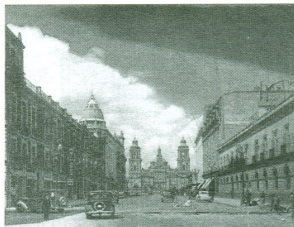
La catedral de México como permanencia. Vista desde la avenida 20 de Noviembre, ca. 1934.

De forma especial, Rossi dedica la última parte de un capítulo al estudio de las permanencias, es decir, de aquellos hechos urbanos pasados que forman parte de nuestra experiencia presente. Esta discusión que se refiere a lo que podríamos llamar patrimonio, gira en torno a la relación entre monumento y ciudad. Para Rossi los elementos que permanecen pueden adquirir dos connotaciones distintas y opuestas: existen por un lado elementos permanentes que pueden ser considerados como patológicos y otros que pueden ser entendidos como propulsores. Los primeros son aquellos que han dejado de tener un significado en la experiencia urbana y que parecen remanentes de un tiempo remoto; los segundos son aquellos que renuevan su significado y reformulan su relación con la ciudad y sus habitantes. Son hechos que permanecen por "su valor constitutivo, por la historia y el arte, por el ser y la memoria". 5