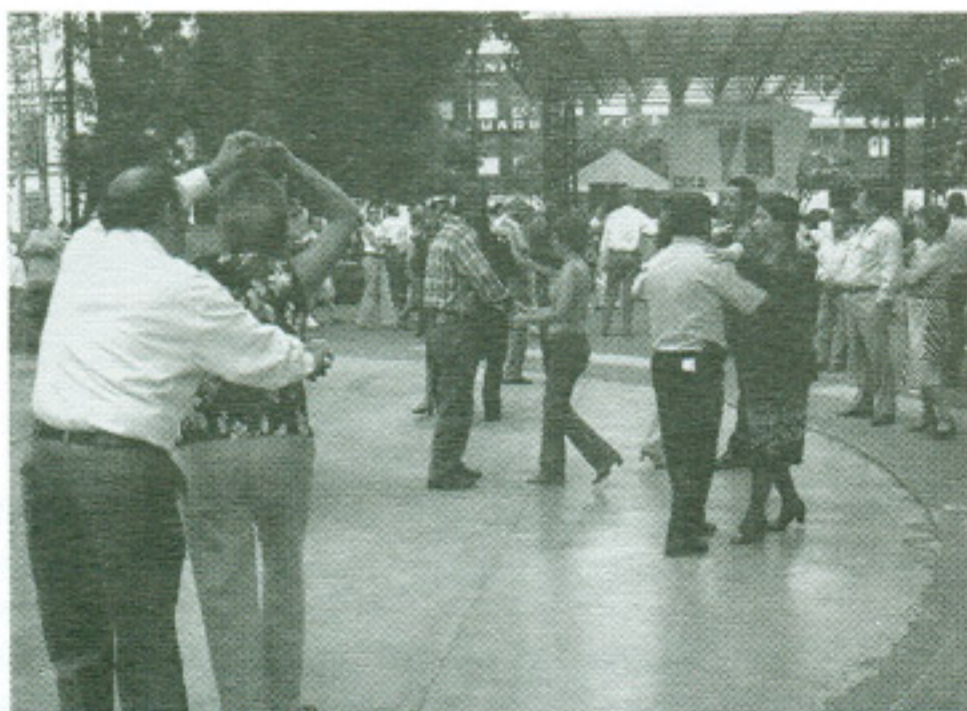
Arquitectura y ciudad en México, Plaza Danzón.

Por todo lo anterior, en la época contemporánea y de acuerdo con la producción arquitectónica actual, La arquitectura de la ciudad se constituye como una aportación vigente y un análisis profundo de la ciudad y la arquitectura que permanece, en términos rossianos, como un elemento propulsor. Propulsor porque vive y se resignifica en el momento presente. Ante las formas de hacer ciudad y construir arquitectura caracterizadas por el desentendimiento de la historia y de la memoria colectiva, por una especulación acelerada del valor del suelo, por una presencia sustentada en la espectacularidad mediática de las arquitecturas concebidas como objetos de consumo suntuario, esta obra adquiere un significado renovado que sugiere para sus lectores la imperiosa necesidad de seguir trabajando por una humanización de la arquitectura y una arquitecturización del hombre. ●