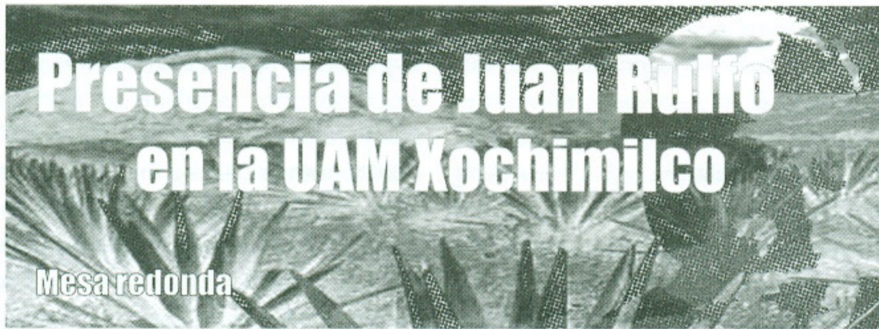
Cartel Presencia de Juan Rulfo