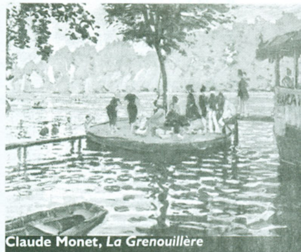
Claude Monet, La Grenouillère

Pintor francés, nacido el 14 de noviembre de 1840 en París. Es, sin duda, el máximo representante del impresionismo. Gracias a él surge el movimiento impresionista, consolida sus teorías, gran parte de sus técnicas, muchos de sus temas predilectos, y hasta su nombre. En 1876 se instala en Argenteuil, a orillas del Sena, en donde realizó sus más célebres series pictóricas y en donde su pintura encontró definitivamente la visión impresionista del paisaje. En 1883 Monet se establece en Giverny, que sería su residencia hasta el fin de sus días y en donde daría a luz su serie de últimas pinturas de Nenífares .