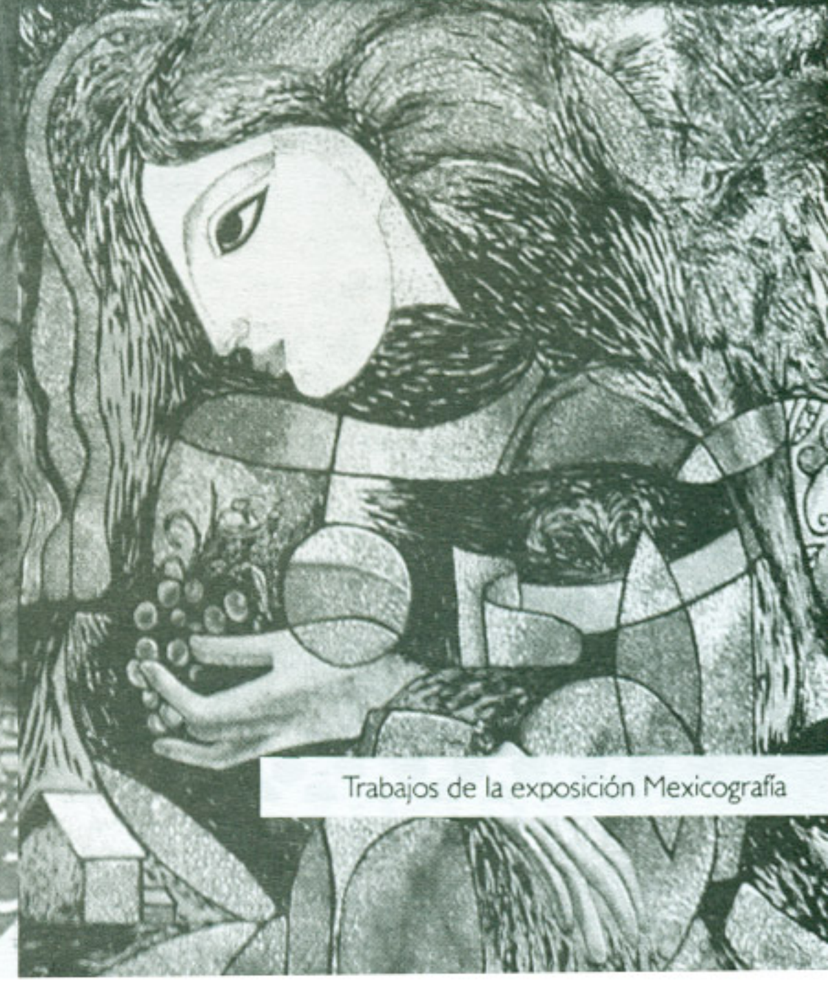
Trabajos de la exposición Mexicografía