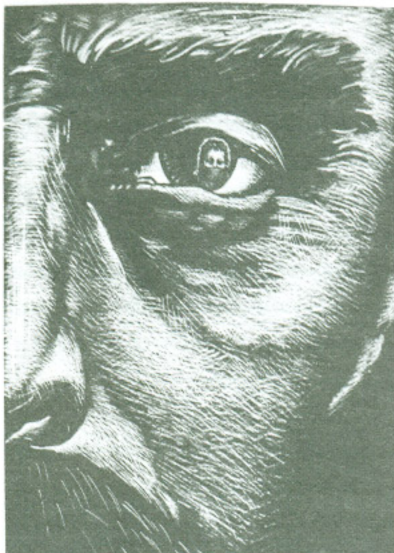
Mirando al porvenir

corazón del pueblo. También mencionó que la ceiba pasa a ser, en la obra expuesta, no sólo fuente de vida, sino ojos vigilantes, haciendo alusión al discurso del subcomandante Marcos, así, el diseñador retoma su papel de comunicador y retorna al diálogo con su realidad.