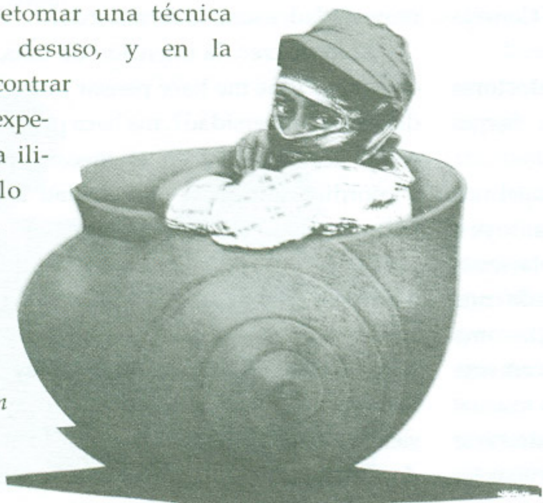
Espíritu de la tierra

No dejes de visitar esta exposición que te permitirá retomar una técnica aparentemente en desuso, y en la cual podrás encontrar posibilidades de experimentación gráfica ilimitadas, como lo muestran sus obras, Mirando el porvenir , Rumbo a la realidad , La luna , De nuevo otra vez , Dos ejército , dos líderes , Votán Zapata y Chiapas es México , entre otros.