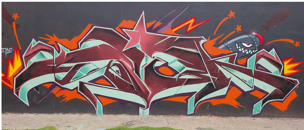
Figura 4: Dipek, pintura realizada en la colonia Romero Rubio, octubre de 2024. Imagen: Dipek.