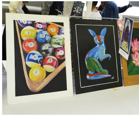
Figura 2, 3 y 4: Exposiciones de los alumnos de la Licenciatura en Diseño de la Comunicación Gráfica.