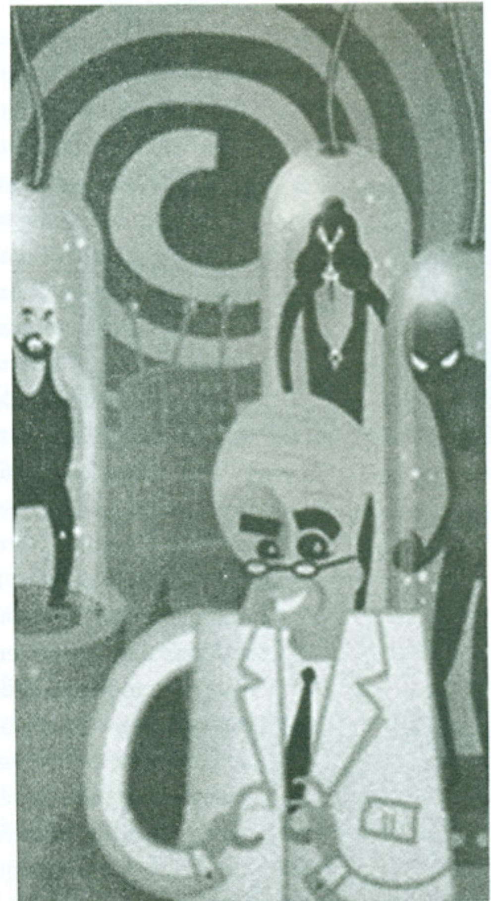
Ilustraciones: Jorge Alderete