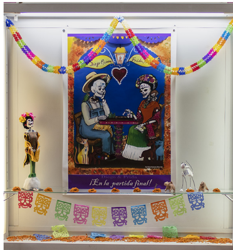
Figura 2: ¡En la partida final! Autora: Georgina Salazar Bustamante.

Es como acercar el arte a la comunidad de la Licenciatura; montamos exposiciones muy variadas: obra gráfica, expositores externos, obras de algunos profesores que hacen obra plástica, entonces tratamos de exhibir lo más diverso posible. Durante