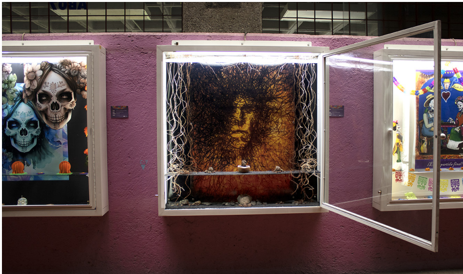
Figura 5: Ofrendas expuestas en la Galería del Pasillo

como aserrín, flores y otros objetos se comparten y se integran en la obra final. Si bien cada participante guarda celosamente su tema, el resultado final refleja la diversidad de perspectivas y la conexión única que surge de nuestra colaboración.