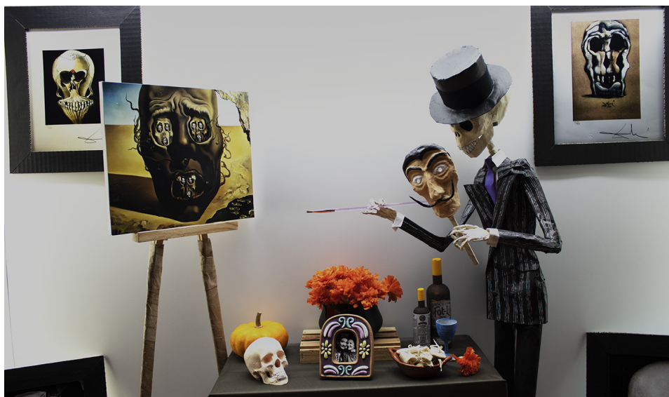
Figura 3: Homenaje a Dalí. Autora: Cristina Rodríguez García.

destacados, Erika Cortés e Israel Isidro, quienes impartieron un curso de Art Toy en el que tuve el privilegio de estar y aprender junto con ellos.