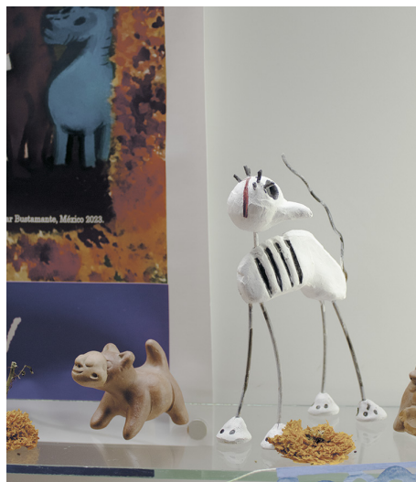
Figura 6: Elementos de ¡En la partida final!

RPS: Es cualquier tema que tenga alguna relación con el Día de Muertos, entonces cada uno aborda su ofrenda de forma totalmente individual. Hay unas que son un poco más comerciales que otras, no, por ejemplo, los