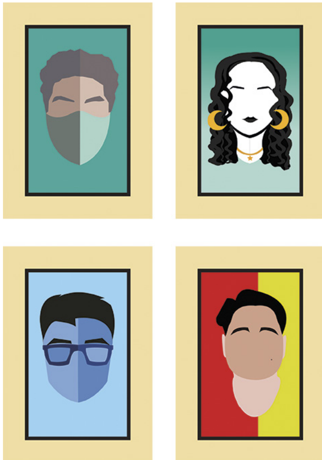
▲ Figura 4: Resultados del grupo AB04, técnica digital.

color o textura con diferentes técnicas análogas y digitales, hasta los elementos de ordenamiento, como el equilibrio, la simetría o la jerarquía.