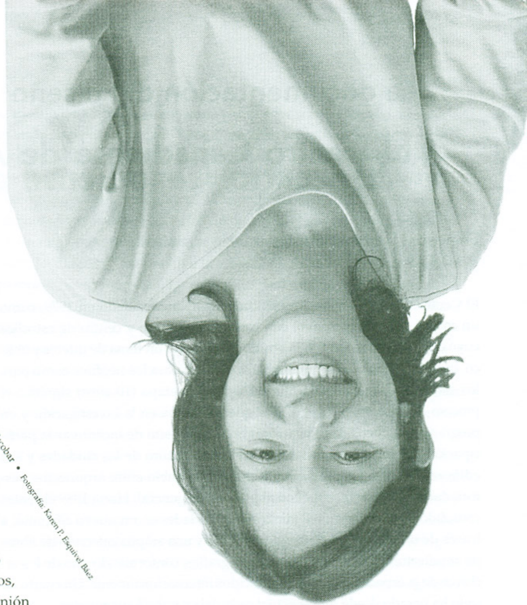
Trabajos de Vanessa Escobar • Vanessa Escobar