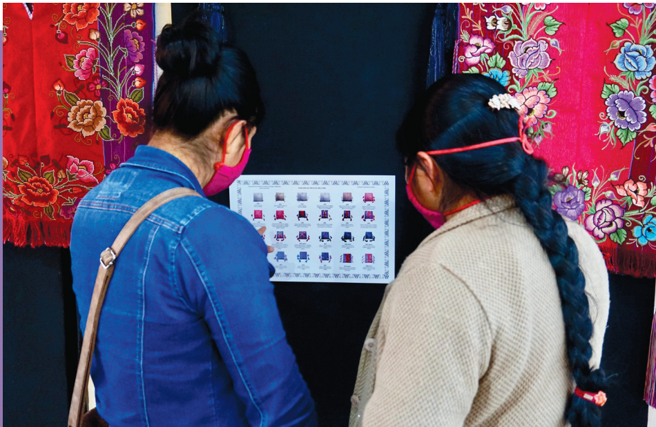
Figura 5: Inauguración de la Exposición Guía Textil de Los Altos de Chiapas: Zinacantán, abril 2020, Museo Na Bolom.

con máquinas de coser, para finalmente unirlos mediante costuras. Una vez confeccionada la prenda, los pok'ul se llevan los domingos al mercado principal, ubicado en la cabecera municipal, para su venta, aunque la mayoría no incluye las características borlas ni el listón ribeteado en el cuello. En cada hogar, es tarea de las mujeres elegir los colores, tanto de los hilos que formarán las borlas, como de los listones.