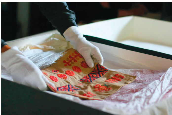
▲ Figura 4: Catalogación de la Colección Textil del Museo Na Bolom.

res descubren el ahorro de tiempo que pueden tener en las labores de bordado, gracias a las máquinas de coser Singer, y adquieren varias que utilizan no sólo para sus prendas personales, sino para ofrecer el servicio a sus vecinas 4 .