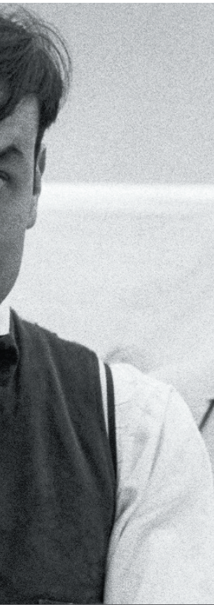
Figura 2: Yves Klein en Antropometría azul .

daísta y uno de los fundadores del Nuevo Realismo, movimiento en el que se pretendía unir vida y arte en un sólo elemento.