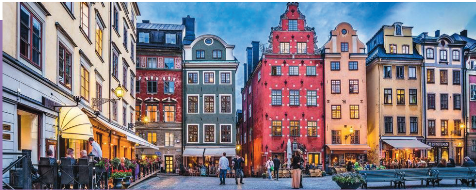
Figura 3: Gamla Stan, Estocolmo, Suecia. shorturl.at/hiq09