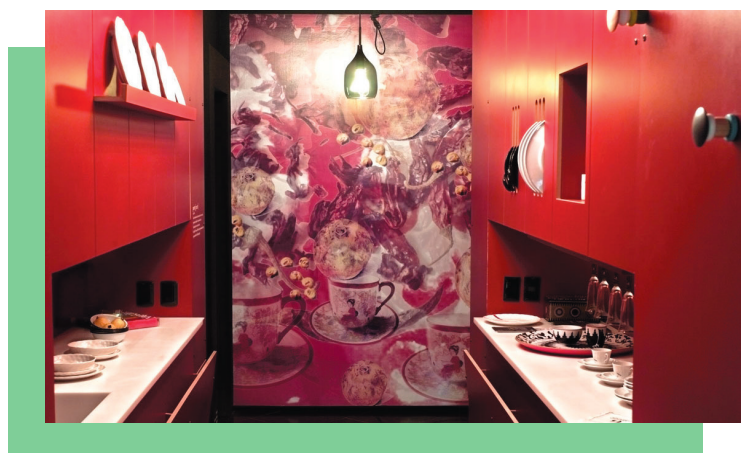
Figura 4: Pantry , diseño de espacio interior en la casa intervenida en Design House, México, 2012, por Beata Nowicka con la propuesta gráfica de Martha Flores.

El diseñador es el organizador profesional del espacio. En ese aspecto, está el espacio externo y el interno del espacio habitable con todas sus modalidades