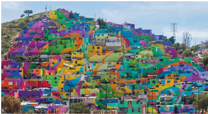
Figura 5: Mural gigante en el Barrio Palmitas de Pachuca, Hidalgo. shorturl.at/lopXZ

arquitectónicas, es por ello que, es importante saber a qué se refieren los siguientes conceptos.