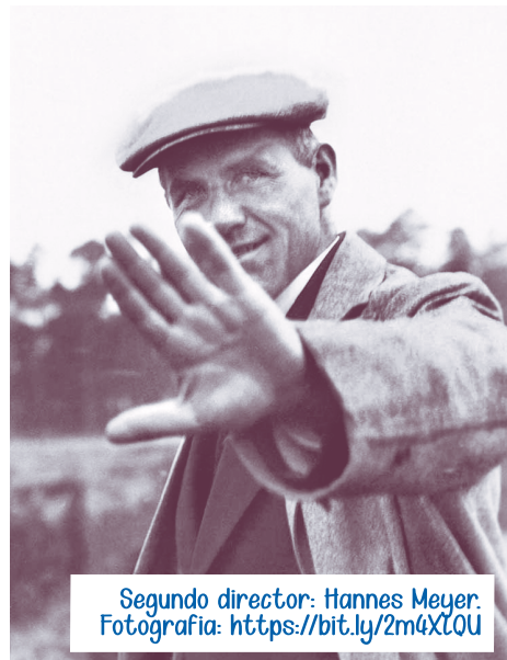
Segundo director: Hannes Meyer.