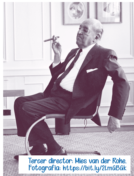
Tercer director: Mies van der Rohe.