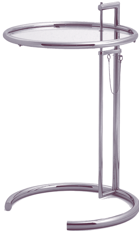
Imagen derecha: Lámpara de la Bauhaus