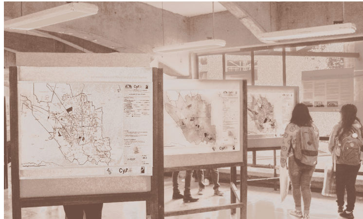
✦ Muestra de trabajos en la planta baja del edificio “q”.

Los carteles presentaron un resumen gráfico de los resultados de investigación, incluyeron información del proceso metodológico, la localización, descripción y diagnóstico de la zona de estudio, así como algunos planteamientos para propuestas. Se definieron también las escalas