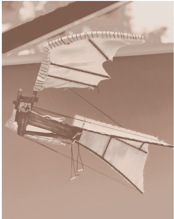
♦ Representación de la Máquina de Volar de Leonardo da Vinci.

de ingeniería, anatomía, mecánica, etc., a la humanidad. En la exposición se desarrollaron bocetos y maquetas de los inventos de Leonardo da Vinci como el paracaídas, el puente, los engranajes, la ballesta gigante y las alas. También se presentaron trabajos de Filippo Brunelleschi; los alumnos construyeron la cúpula de Santa Maria del Fiore cuya virtud fue que Brunelleschi inventó muchas de las técnicas y herramientas para edificar, por esta razón se representó la cúpula con un corte transversal para que podamos conocer la construcción y el montaje, además agregaron las distintas herramientas y mecanismos utilizados para su construcción.