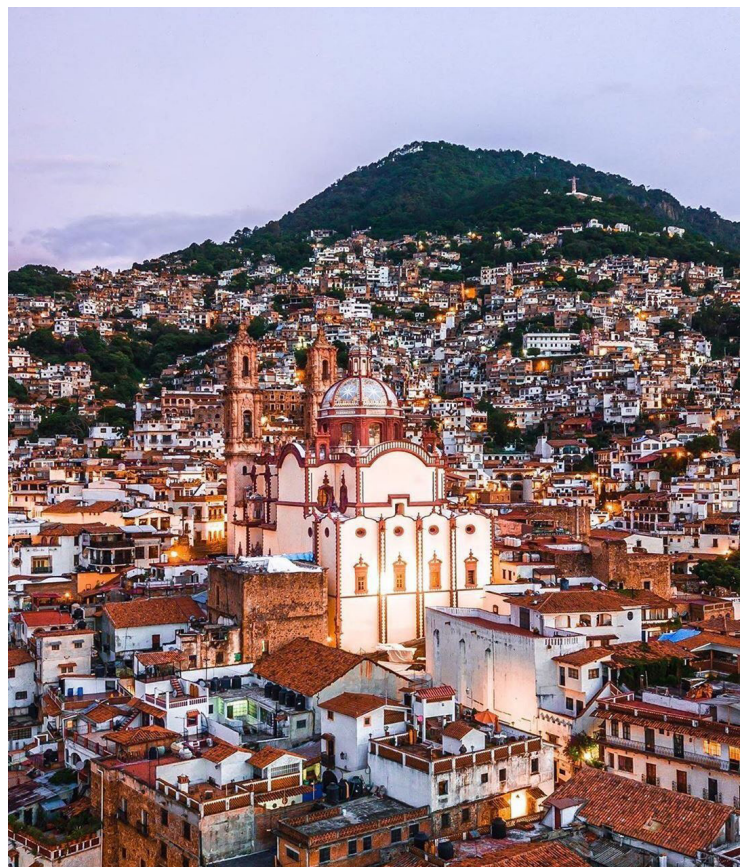
Figura 8 Taxco de Alarcón, Guerrero.