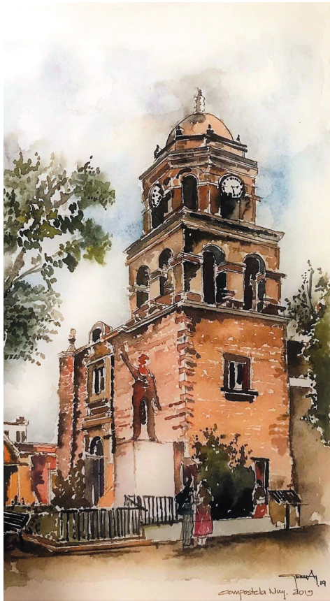
Figura 2 Parroquia de Santo Santiago Apóstol en Compostela, Nayarit. Autor: Arq. Gustavo García Balderas

El valor de estos pueblos tiene una gran significación, ya que se ha convertido en un rasgo que conforma su origen como pueblo originario reconfigurado con elementos de determinadas cualidades tanto sociales como productivas, es decir, en su ámbito arquitectónico-urbano. Como concepto lo podemos sintetizar de la siguiente manera: Pueblo Mágico es un pueblo que, a través del tiempo, ha conservado, valorado y defendido su herencia histórica, cultural y natural, manifestándose en expresiones de su patrimonio tangible e intangible.