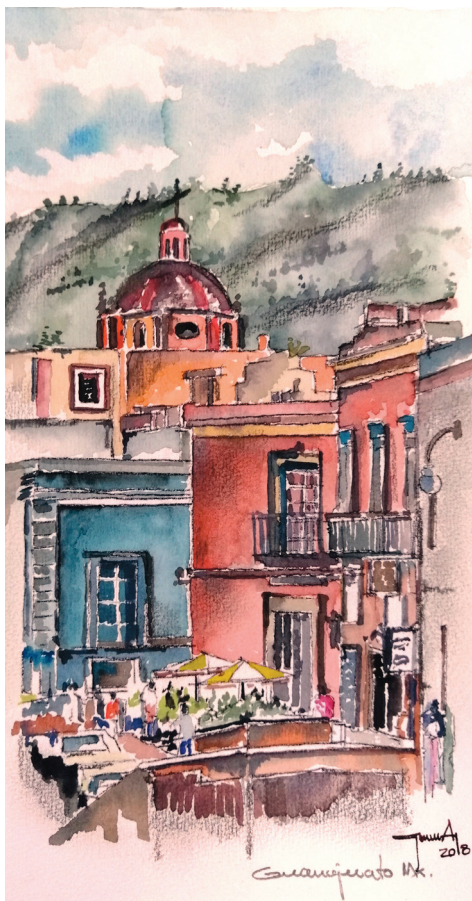
Figura 4 Paisaje del Pueblo Mágico de Dolores Hidalgo, Guanajuato. Autor: Arq. Gustavo García Balderas.

Como sociedad es vital revalorar cada lugar o sitio al que vamos de visita o por motivos de trabajo. En la medida en que se mantenga el Programa de Pueblos Mágicos y se aporten recursos a las localidades se podrán mejorar no solo los recursos de los lugareños, sino también el crecimiento sostenido derivado de diversos aspectos como ya se han anotado, sobre todo de la infraestructura del lugar como caminos, remozamientos, limpieza, reforestación