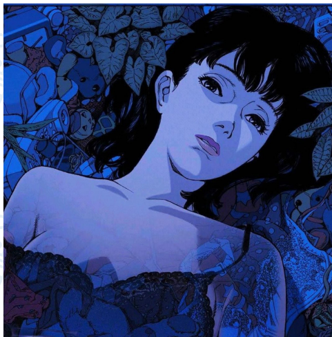
Perfect Blue (1997) Dirigida por: Satoshi Kon

Esta película de animación japonesa nos cuenta la vida de Mima, una cantante de J-Pop que decide incursar en el mundo de actuación para así tener un poco más de éxito en su carrera profesional. Sin embargo, este nuevo camino trae consigo muchos cambios en su vida privada ya que hay alguien que se encuentra obsesionado con ella.