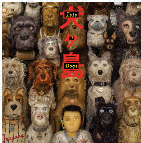
Isle of Dogs (2018) Dirigida por: Wes Anderson

En año 2015 el director Wes Anderson anunció que regresaba al stop motion y tres años más tarde llegó Isle of Dogs . Para esta película el equipo de producción creó alrededor de 20 mil caras y más mil muñecos de los personajes, por lo que fue necesario que los escultores trabajaran 6 días a la semana y los detalles de cada personaje fueron trabajados alrededor de 2 a 3 meses. Esta película nos muestra el viaje que debe hacer un niño de 12 años para buscar a su perro, después de que todas las mascotas caninas sean exiliadas de la ciudad de Megasaki a una isla.