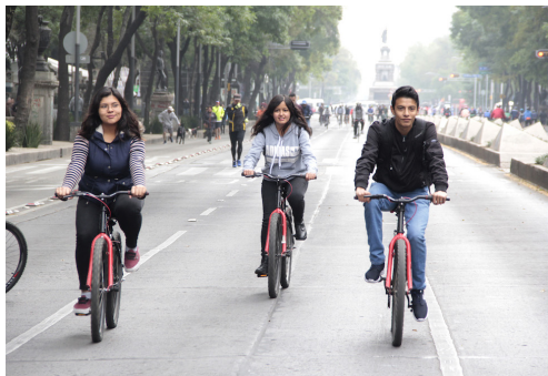
Figura 2: Jóvenes sobre Avenida Revolución en paseo ciclista

América Latina, en el proyecto Jóvenes y metrópoli: movilidad territorial y diversidad cultural , 1 se planteó la dificultad de medir y delimitar la problemática socio-cultural de los jóvenes en México y en particular de la Zona Metropolitana del Valle de México (ZMVM). En esta investigación, se señala lo preocupante que es reconocer que el gobierno mexicano no ha tenido la capacidad para aprovechar el bono demográfico y contrarrestar el descenso de la tasa de fecundidad de la población, si bien el porcentaje de jóvenes en este momento está en descenso como efecto del proceso de transición demográfica, que se materializa con el crecimiento de las personas de 60 años y más en nuestro país como en toda América Latina. De ahí, preocuparse por los jóvenes significa el atender las necesidades en el futuro de los adultos de hoy. La viabilidad económica de México en las próximas décadas dependerá de las oportunidades que tendrán los jóvenes en el mercado laboral, conocer ¿quiénes son los jóvenes y las jóvenes en nuestro país? es importante para entender la realidad y establecer las políticas públicas que pueden tener un impacto y resultados a corto, mediano y largo plazo.