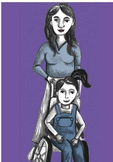
Ilustración realizada por Lis del Carmen López Sánchez

La doctora Alejandra Prieto, en la segunda sesión del seminario, expuso algunas de las dificultades que sortean las mujeres que son madres de niños que nacen y viven con alguna discapa-