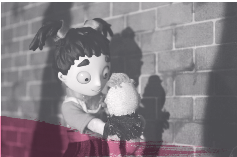
Fragmento del cineminuto "Comedor Santa María"

Dirección: Roberto Padilla Sobrado https://youtu.be/i_m-X_sTBXc