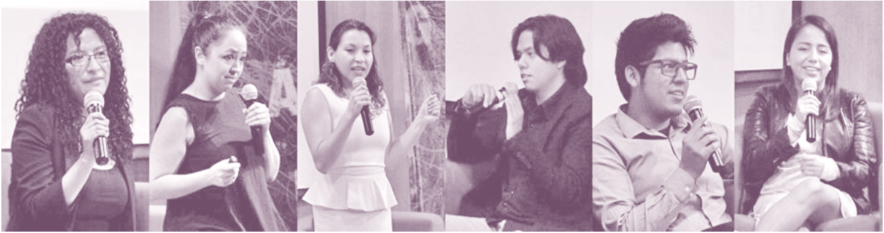
Tercer Congreso de Egresados de la Licenciatura de la Comunicación Gráfica, 9 junio de 2017