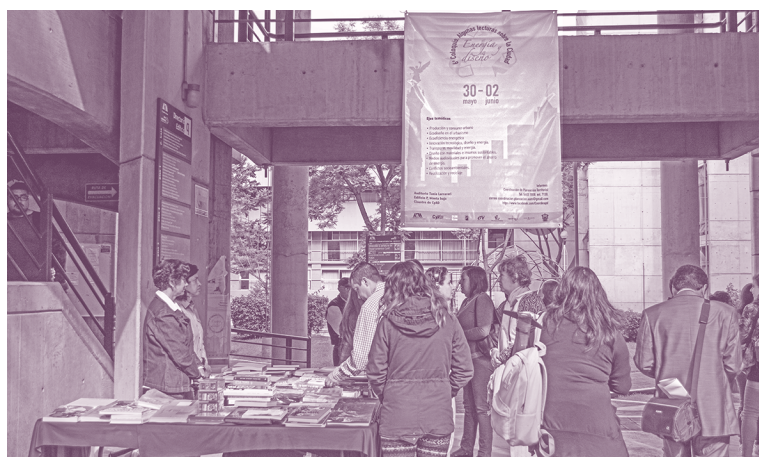
6ª Feria del Libro y la Ciudad