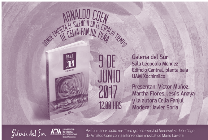
Cartel de la presentación del libro Araldo Coen: Donde empieza el silencio en el espacio tiempo de Celia Fanjul Diseño: Vania Bartolini

naldo Coen y felicitar a la autora; también nos habló del gran esfuerzo que significó recaudar la información y el material gráfico para el desarrollo de su investigación.